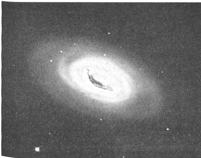
Bild 2: Spiralnebel im Sternbild Coma Berenice. Trägt in den Nebelkatalogen die Nummern M 64 oder N.G.C. 4826. (Aufnahme der Mt. Wilson-Sternwarte mit 60 Zoll Spiegelöffnung bei acht Stunden Belichtungszeit.) Die eng gewundenen Spiralarme deuten auf ein Sternsystem früher Entwicklungsphase.

die andern milchstraßenähnlichen Sternsysteme – mit großer Geschwindigkeit auseinanderstieben. Der geschlossene endliche Raum ist also in Erweiterung begriffen, und wir kennen die Ausdehnungsgeschwindigkeit recht genau. Lassen wir jetzt in Gedanken den Film dieser kosmischen Entwicklung rückwärts laufen und das in Wahrheit sich ständig ausdehnende Weltall sich allmählich verkleinern! Im Verlauf von etwa drei