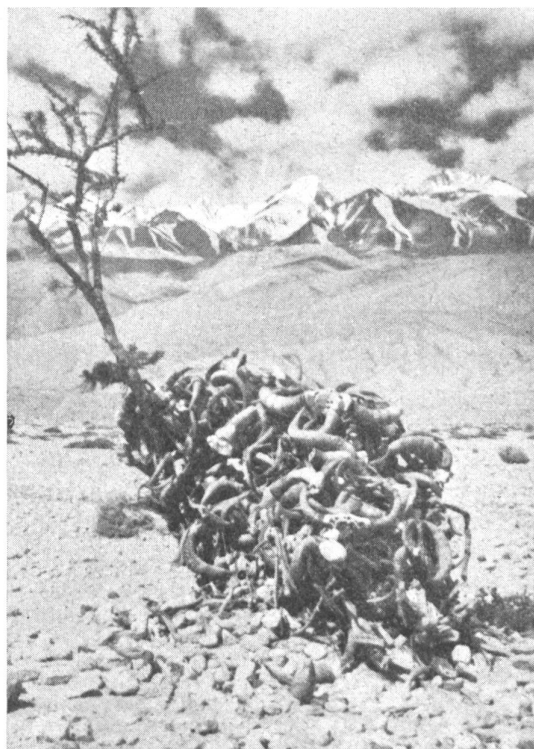
Bild 3: Auf einer Paßhöhe zu einem Haufen zusammengetragene Yakhörner zur Abwehr der bösen Geister.

Das Gegenstück zu den Zauberdoktoren sind die eigentlichen Ärzte oder besser gesagt die Heilkundigen (Iharjey), deren medizinische Kenntnisse zum Teil aus Indien, dem Ursprungsland des Buddhismus, zum Teil aber aus China stammen und die nicht allzugerade zu veranschlagen sind. Es sind fast ausschließlich Lama, die ihre Kenntnisse in einer Klosterschule erworben haben, wo auch Medizin als Lehrfach betrieben wird. Nicht zu Unrecht kann man daher von einer lamaistischen Heilkunde reden, als deren Schutzpatron der indische Arzt Dschivaka, der Sohn des Königs Bimbisara von Magadha, ein Zeitgenosse von Gautama Buddha, angesehen wird. Wahre Wundergeschichten werden von