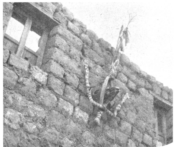
Bild 2: Widderschädel mit Strofigur und Fadenkreuzen zur Beschwörung und Abwehr der Erdgeister an der Wand eines Wohnhauses in der Nähe von Leh.

Die tibetisch-buddhistische Glaubensformel, «Om mani padme hum», ist übrigens nicht bloß das bekannteste und meistgesprochene Gebet, sondern zugleich eine Formel, die die bösen Gei-