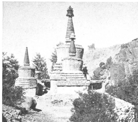
Bild 5: Tschörten in der Nähe von Hemis.

So soll Antilopenhorn bei Fieber und Durchfall helfen, vom Moschus wird gesagt, daß er Verstopfung heile, Bärengalle soll blutstillende Wirkung haben, Hammelhirn Schwindelgefühl beseitigen. Von den mineralischen Stoffen stehen wohl Quecksilber und Gold obenan. Ersteres wurde schon von jeher zur Behandlung von Lues angewendet, wie übrigens auch in Indien, Gold, in Form von Staub oder Blattgold gegen Lungen- und Herzleiden. Nicht minder überrascht auch die Anwendung von allerhand Mineralien und Edelsteinen (Lapislazuli, Achat, Türkis, Rubin, Saphir usw.), Korallen, Bernstein und selbst Perlen. Die teuren, schwer zu beschaffenden Heilmittel werden, wie nicht anders zu erwarten, auch als die wirksamsten angesehen.