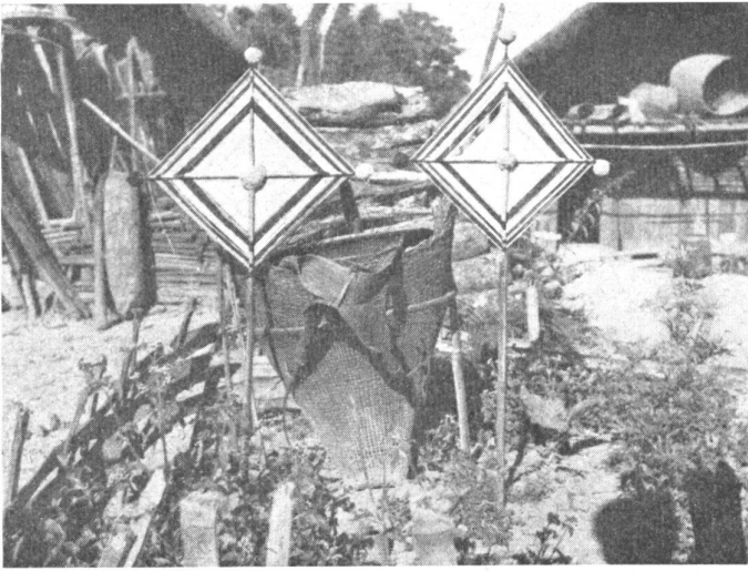
Bild 1: Mit schwarz-weiß-roten Fadenkreuzen versehenes Grab der Angami-Naga.

Formeln, die oft auch innerlich angewendet werden. Demselben Zweck dienen auch Pillen, schwarze Kugeln aus Gerstenmehl, die Reliquien von Heiligen, sogar Stückchen Kot vom Dalai-Lama enthalten. In vielen Fällen erfolgt die Heilung, wie man glaubt, durch Vermittlung überirdischer Mächte, durch die Schutzgottheiten.