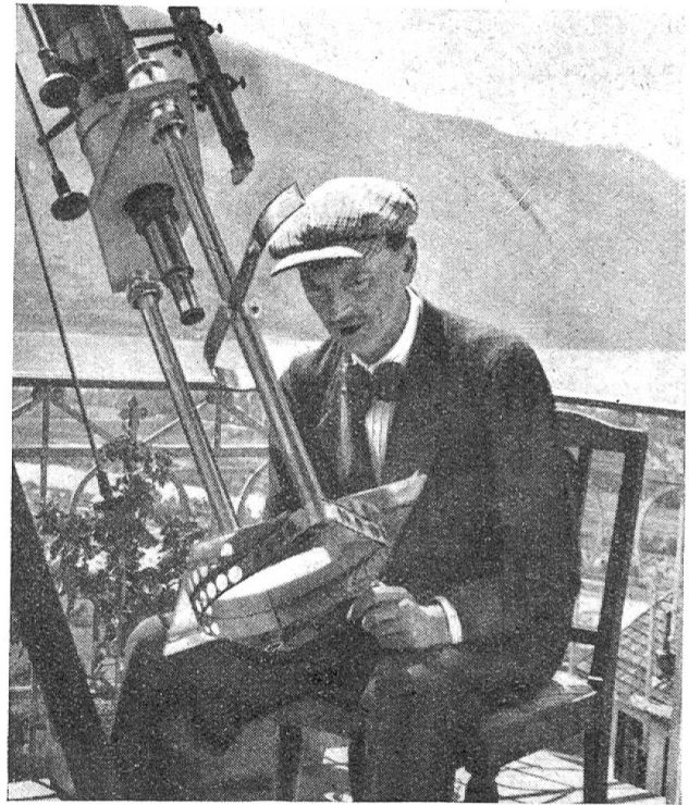
Bild 9: Projektionstisch mit Beobachter. In der Praxis wird unter einem schwarzen Tuch gearbeitet. Auf einem weißen Blatt Papier sieht man die Sonne mit 25 cm Durchmesser und auf ihr alle Flecken und Randfackeln in großer Präzision. Die Gebilde werden täglich nachgezeichnet nach Lage und Form. Solche Zeichnungen bilden die Unterlage für die Sonnenstatistik der Eidgenössischen Sternwarte, die gleichzeitig internationale Zentralstelle für Sonnenforschung ist