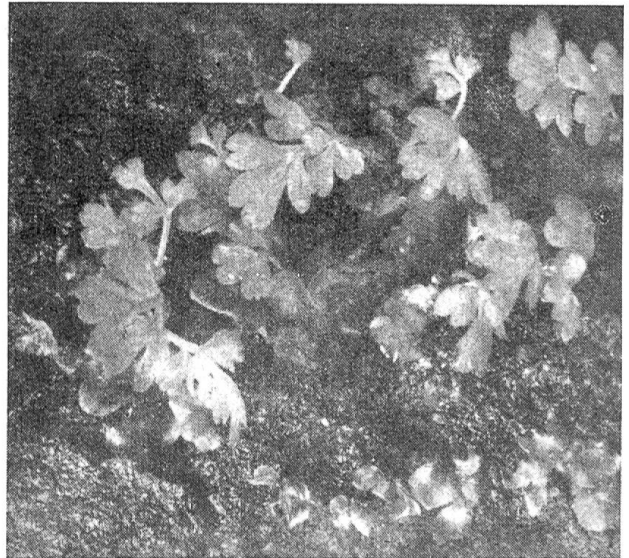
Abb. 2: Die jungen Farnpflänzchen beginnen aus den Prothallien herauszuwachsen

zen. Sie sind keilförmig und erzeugen in ihrem Innern eine große Zahl von spirällich gewundenen Spermien, die an ihrem oberen Ende ein ganzes Büschel Geißeln tragen. Bei feuchtem Wetter öffnet sich dieses „Antheridium“ genannte männliche Organ, und die Spermien