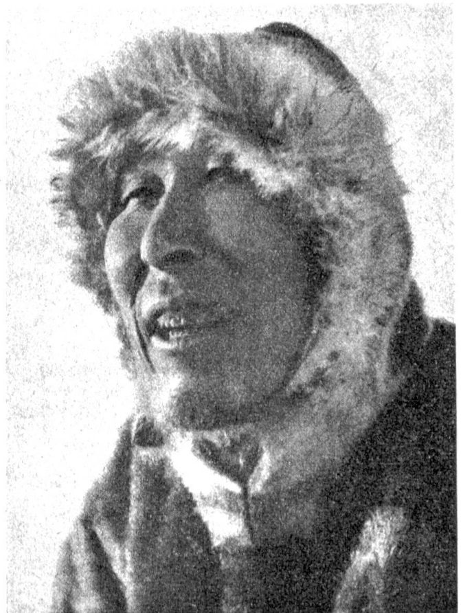
Abb. 1. Typischer Eskimo aus Grönland

gelangten die Eskimos an die Eismeerküsten. Eine völlig neue Umwelt trat ihnen entgegen. Es hieß, sich entweder an diese anzupassen oder unterzugehen. Die Eskimos haben sich behauptet. Sie übertrugen ihre alten winterlichen Fischereimethoden auf die Seehundjagd und wurden Seehundjäger. Eigene Erfindergabe und die Fähigkeit, von außen auf sie eindringende Anregungen weiterbildend auszuwerten, machten es den Eskimos möglich, ihre Waffen und Geräte ständig zu verbessern und Gebiete in Besitz zu nehmen, die bislang von Menschen unbewohnt gewesen waren. Mit Hilfe der kunstvoll gebauten Boote, die unter dem Eskimonamen Kajak (Männerboot) und Umiak (Weiberboot) weit über die Grenzen ihres Landes bekannt geworden sind, haben die