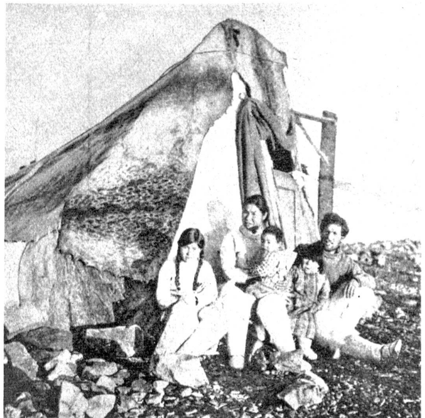
Abb. 4. Eskimo aus Grönland vor ihrem mit Seehundsfellen gedeckten Sommerzelt

ven) und europäische Geräte ein. Von ausschlaggebender Bedeutung für das Wirtschaftsleben der Eskimos und somit für die Erhaltung ihres körperlichen Daseins war jedoch die durch die USA.-Regierung eingeführte Renttierzucht. Im Jahre 1892 wurden die ersten gezüchteten Rentiere — es waren 179 Stück — aus Sibirien mit Lappen als Instruktoren nach Alaska gebracht. Die Eskimos erlernten die Renttierzucht. Weitere Renttierherden folgten nach. Im Jahre 1902 wurden bereits 1280 Rentiere in Alaska gezählt und im Jahre 1930 war ihre Zahl auf 712.000 Geweihe angestiegen. Zwei Drittel davon sind für die Eskimos bestimmt — heißt es —, der Rest gehört den weißen Ansiedlern, Lappen und Missionen. Ungefähr 13.000 Eskimos sind bereits wirtschaftlich von den Renttieren fast vollkommen abhängig. 2500 Eskimos besaßen in diesem Jahre bereits eigene Renttierherden. Renttierfleisch und Renttierfelle werden exportiert und bilden für die Eskimos eine wichtige Einnahmequelle (J.Haekel). Ähnliche Versuche mit der Renttierzucht sind auch bei den kanadischen Eskimos im Gange und haben nach anfänglichen Mißer-