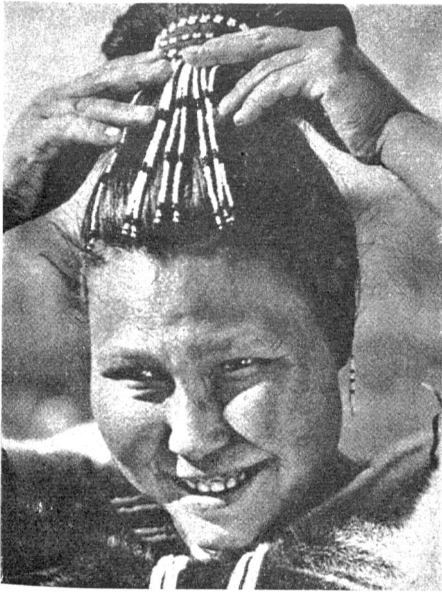
Abb. 3. Die Eskimos sowohl der nordamerikanischen wie auch der grönländischen Siedlungsgebiete sind heute vielfach mit Europäern vermischt. Das Bild zeigt eine reinrassige Eskimofrau aus einem der entlegendsten Siedlungsgebiete in Grönland

Die Lebenshaltung der Eskimos beruhte auf der Jagd auf Robben, Walrosse und Wale. Daneben spielte der Fischfang eine wichtige Rolle.