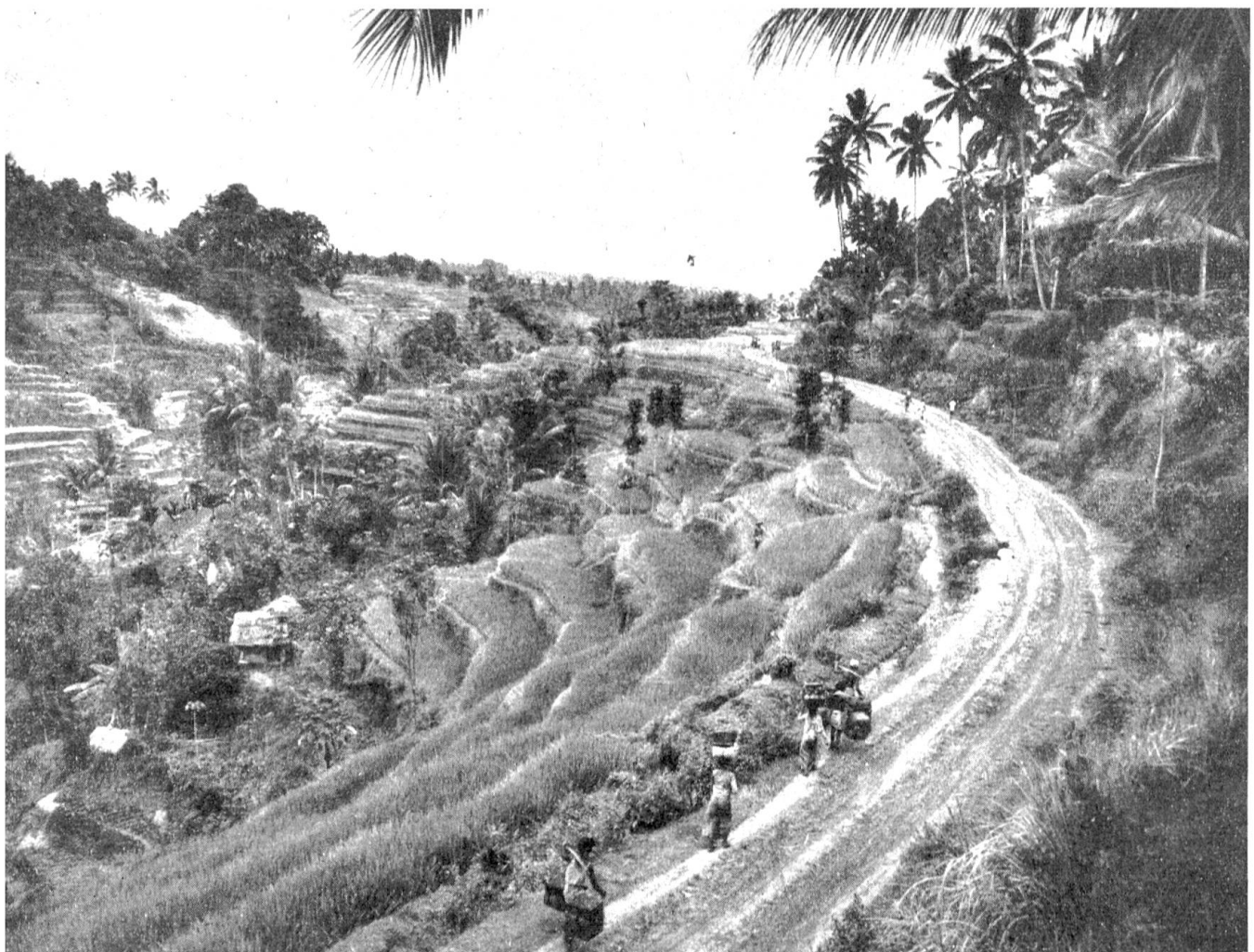
Abb. 6. Ein typisches Bild der javanischen Landschaft, deren besonderes Merkmal die Terrassenkulturen sind

von hier aus die Reise über den 3200 km breiten Atlantik nach Neufundland antreten. Der Bordfunker nimmt die Wettermeldungen der im Nordatlantik verteilten Wetterschiffe auf, die von der ICAO (Internationalen Zivil-Luftfahrt-Organisation) in Dienst gestellt wurden. Wenn eine Schlechtwetterfront vor der Flugroute liegt, wird zuweilen der Kurs über Island genommen. Ringsum sind nur das Meer und Wolken zu sehen. Die Stewardess serviert die Mahlzeiten, aus dem Lautsprecher ertönt gedämpfte Musik, die Fluggäste lesen oder plaudern, und so vergeht eine Stunde um die andere. Dann erscheint plötzlich die amerikanische Küste, und bald rollt die Maschine über den Flugplatz von Gander. Noch 1936 befand sich hier auf Neufundland ein namenloses Waldgebiet. Drei Jahre später war Gander einer der größten Flughäfen der Welt, mit modernen Betonrollbahnen, Flugzeughallen, Unterküften, Werkstätten, Treibstofflagern, Kino, Warenhaus und Wohnbauten, kurz, es war eine richtige kleine Stadt entstanden. Doch Gander