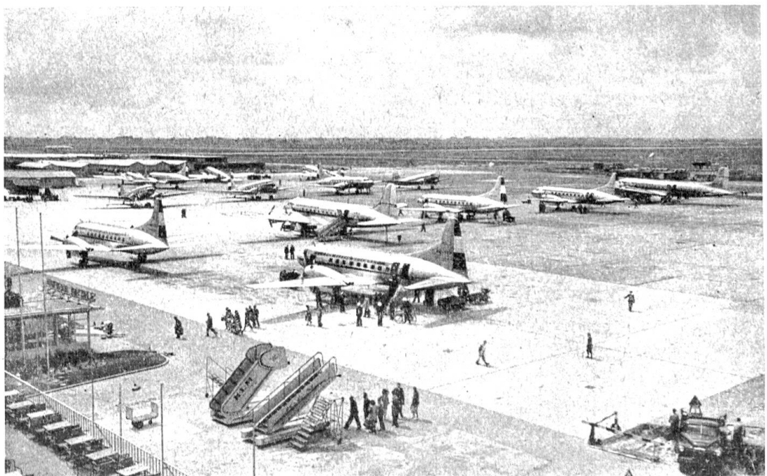
Abb. 1. Schiphol — der Flughafen von Amsterdam ist einer der bedeutendsten Europas. Fast pausenlos landen und starten hier die Verkehrsmaschinen

Jahre währte die erste Weltumseglung — drei Tage fliegt man heute um die Erde. Dabei ist die Geschwindigkeitsgrenze noch nicht erreicht, denn Raketen und Düsenflugzeuge werden wesentlich schneller sein. Ein dichtes Luftverkehrsnetz umspannt heute unsere Erde. Aus den Erfahrungen des Militärflugwesens zweier Weltkriege entwickelte sich eine mächtige Zivilluftfahrt, betrieben von zahlreichen Gesellschaften, die Zehntausende von Menschen beschäftigen und deren Flugzeuge täglich Hunderttausende Flugkilometer zurücklegen. Sie wetteifern darin, ihre Fluggäste rasch und sicher an das Ziel zu bringen und ihnen die Reisezeit so angenehm als möglich zu gestalten. Ihre Flugpläne werden pünktlichst eingehalten, und der Verkehr auf einem großen Flughafen wickelt sich nicht viel anders ab als auf einem großen Bahnhof (Abb. 1). Der internationale Luftverkehr für die Beförderung von Passagieren, Fracht und Post ist heute eine Selbstverständlichkeit. Doch wie war die Entwicklung? Sie soll kurz am Beispiel zweier wichtiger Kontinentalverbindungen gezeigt werden, dem Weg nach Indien und dem Sunda-