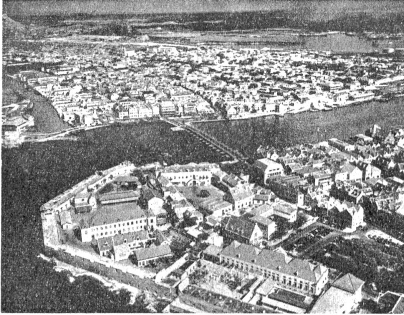
Abb. 9. Willemstad auf Curaçao. Wäre nicht das heiße Klima und die tropische Vegetation, man könnte glauben, in einer holländischen Stadt zu sein