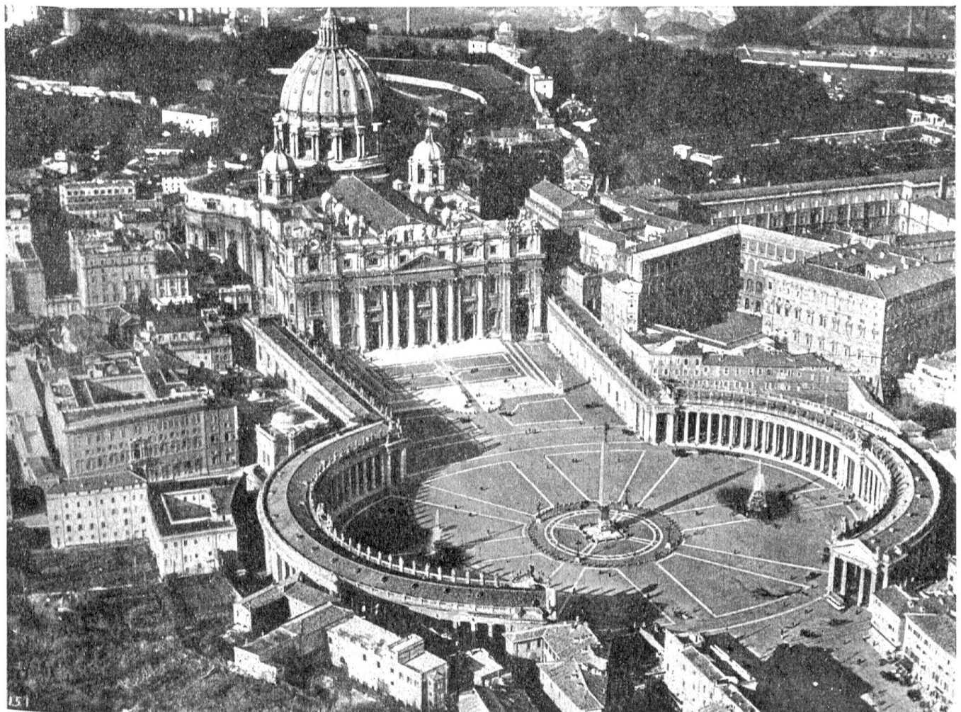
Abb. 2. Flug über Rom und die Vatikanstadt. Im hellen Sonnenlicht leuchtet der mächtige Bau der Peterskirche

Die Flugroute folgt dem mit Palmen bestandenen Tigrisufer bis Basra, wo sich Tigris und Euphrat vereinigen. Zehn Minuten nach dem Start tauchen voraus die großen, der Anglo-Iranian Oil Co. gehörenden Ölraffinerien von Abadan auf. Wenig später geht es über die