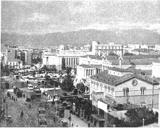
Abb. 3. Athen — Blick auf die Innenstadt mit Universität und Nationalbibliothek

grünen Wasser des Persischen Golfes und die blauen Wogen des Arabischen Meerbusens, doch bleiben die Randgebirge Südirans immer in Sicht; kahle, schroffe Berge, die sich auch an der Küste Belutschistans fortsetzen und das Aussehen einer Mondlandschaft haben. Karachi, wo eine Zwischenlandung erfolgt, überrascht. Es ist eine nahezu moderne, reine Stadt, die nur wenig von der alten orientalischen Romantik aufweist.