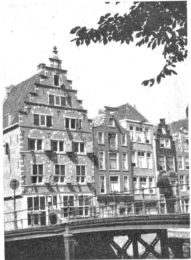
Diese kleine holländische Insel spielt für den westindischen Flugverkehr die gleiche Rolle wie etwa Batavia für die Insulinde. Von hier aus

Wenige Stunden später geht der Flug weiter, wieder über die unendlich scheinende Fläche des Ozeans, nach Süden. So interessant und abwechslungsreich die Ostindienstrecke ist, die Westindienroute führt zu 90% über die eintönige, ewig gleichbleibende Wasserfläche, die nur ab und zu von einem Schiff durchpflügt wird. Der Kurs führt über den Ostteil der Insel Haiti, das alte Hispanola, rechts unten liegt Ciudad Trujillo und dann folgt die Weite der Karibischen See, bis das Ziel dieser Flugreise, Curaçao mit seiner Hauptstadt Willemstad (Abb. 9), erreicht ist.