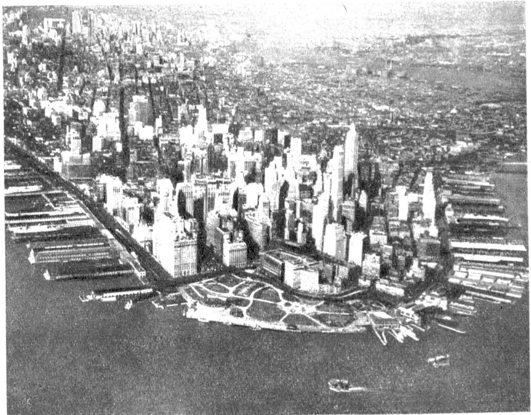
Abb. 8. New York! Im Vordergrund die Wolkenkratzer des Geschäftsviertels, links der North River und rechts der East River, die Man- hattan von Brooklyn und Queens trennen