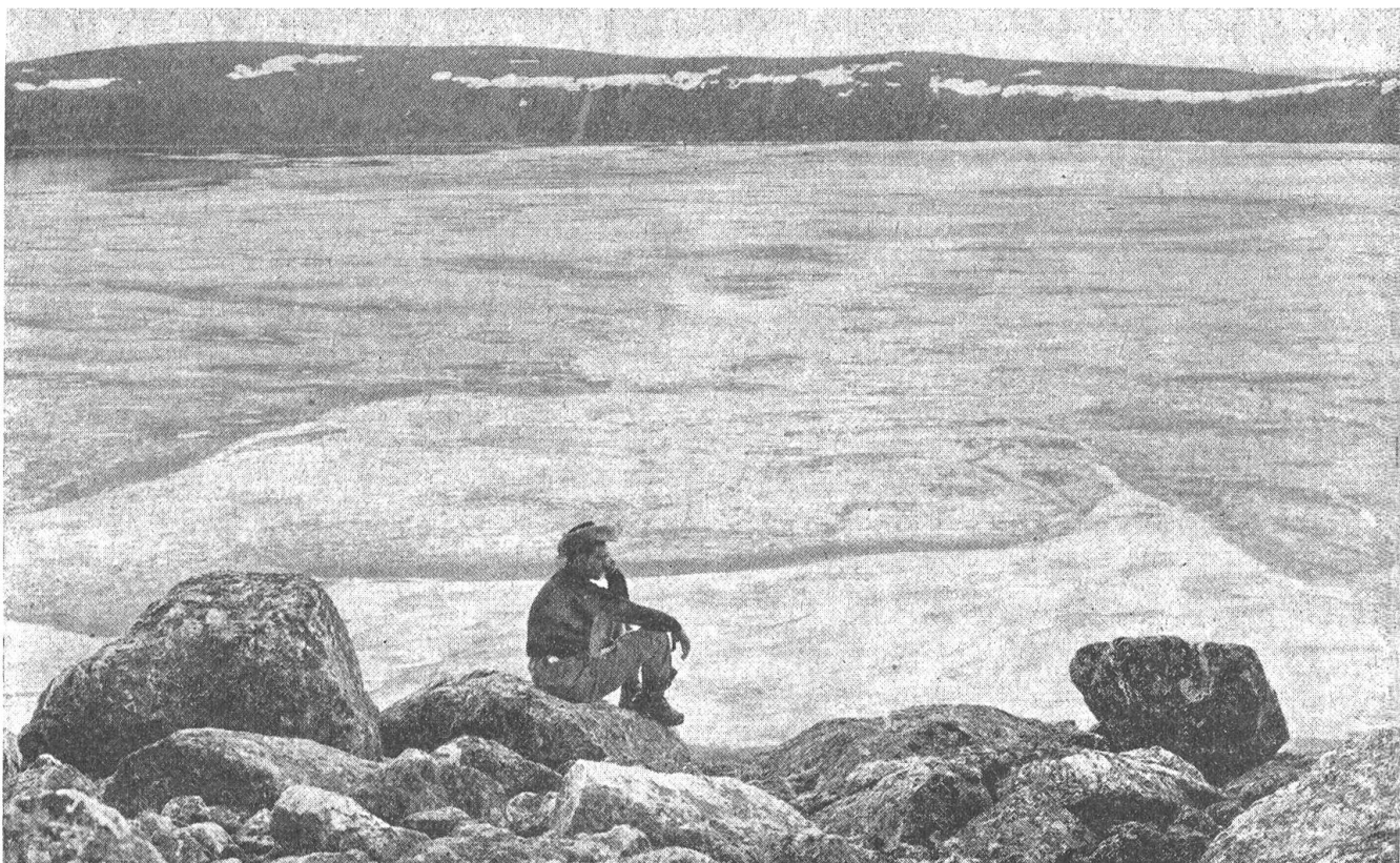
Abb. 2. In der weiten Felstundra des Gebietes von Ungava, im Nordteil der Provinz Quebec auf der Labradorhalbinsel südlich von Baffinland, ereignete sich die gewaltige Naturkatastrophe. Um den See ist heute ein Wall von Granitfelsblöcken aufgetürmt, der eine durchschnittliche Höhe von 180 m aufweist

Meilen ging der Flug von Toronto, bis der geheimnisvolle See in Sicht kam (Abb. 1). Die Expeditionsteilnehmer sahen die ursprüngliche Vermutung bestätigt. Es handelte sich um einen riesigen Meteorkrater von etwa 11,2 km Umfang und einem Durchmesser von 3,6 km. Der Meteor hatte sich etwa 20 m tief in den Granit eingebohrt und einen Ringwall aus Felsblöcken von 180 m Höhe aufgetürmt. Der den Krater erfüllende See war zur Zeit der Expedition (Ende Juli 1950) mit einer etwa 1 m dicken Eisschicht bedeckt und zeigte nur längs des Ufers einige offene Stellen (Abb. 2). Damit waren diese Meteorspuren die größten, die bisher entdeckt wurden, denn der Durchmesser des Teufelskraters in Arizona beträgt nur 1300 m und der vor drei Jahren in West-Australien entdeckte Wolf-Creek-Krater bloß 800 m.