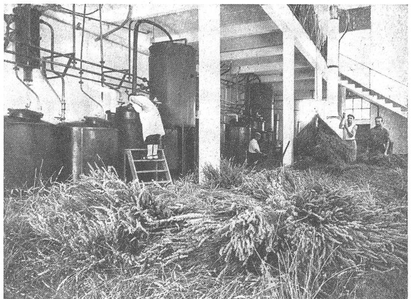
Abb. 3. Der Extraktionsraum einer Parfümessenzfabrik in Grasse, wo sogenannte „concrètes“ durch flüssige Lösungsmittel, wie Aetherpetrol oder Benzin, gewonnen werden. Die am Boden bereitliegenden Pflanzen sind Lavendel

Aber nicht nur ätherische Öle und andere pflanzliche Wohlgerüche liefern die Grundstoffe für die Erzeugnisse der wohlriechenden Wissenschaft, sondern auch aus dem Tierreich werden ganz eigenartige Riechstoffe in den Dienst der modernen Duftchemie gestellt. Auf ihnen basieren hauptsächlich die Patentrechte