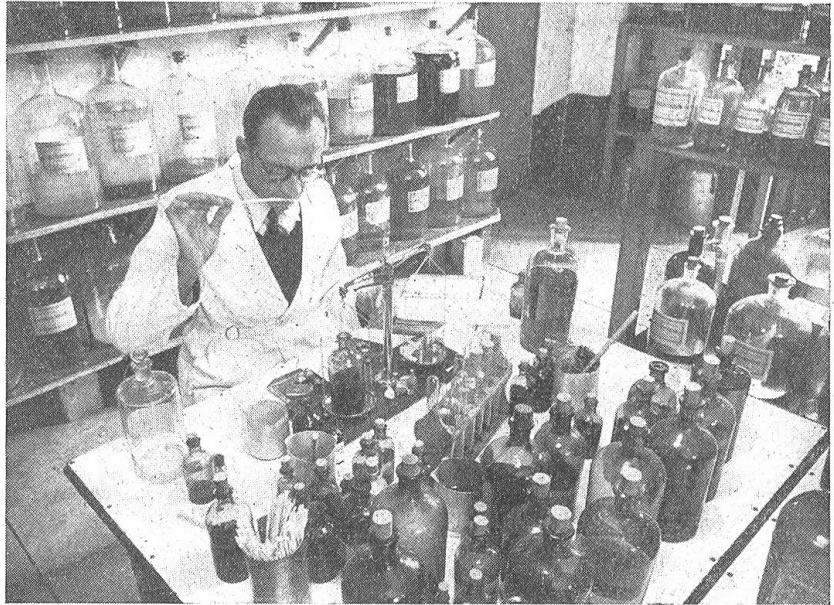
Abb. 5. Dieses Bild zeigt einen Fachmann bei der Arbeit. Wo die chemische Analyse zuweilen versagt, kann nur der menschliche Geruchsinn die geringste Unregelmäßigkeit entdecken. Der Parfümeur muß daher außer seinen Fachkenntnissen auch einen äußerst fein entwickelten Geruchsinn besitzen

der tausend Düfte“ neue Treibhäuser, neue Fabrikshallen, um all den Segen der gleichfalls stets wachsenden Blumenkulturen zu verarbeiten. Dieses Aufbereiten, Mischen und Konservieren feinsten natürlicher Düfte und Aromen, wie sie seit Jahrtausenden in den verschiedenen Kulturkreisen der Erde immer wieder angewandt wurden, hat sich zu einer Wissenschaft entwickelt. Aus der auf Geheimrezepten basierenden uralten Kunst des „Spezereienmischens“ der alten Ägypterinnen wurde ein Spezialzweig der modernen Chemie, der wieder Hand in Hand mit der Technik eine gewaltige Industrie aufgebaut hat. Es ist die internationale Parfümindustrie, die in manchen Ländern mit ihren