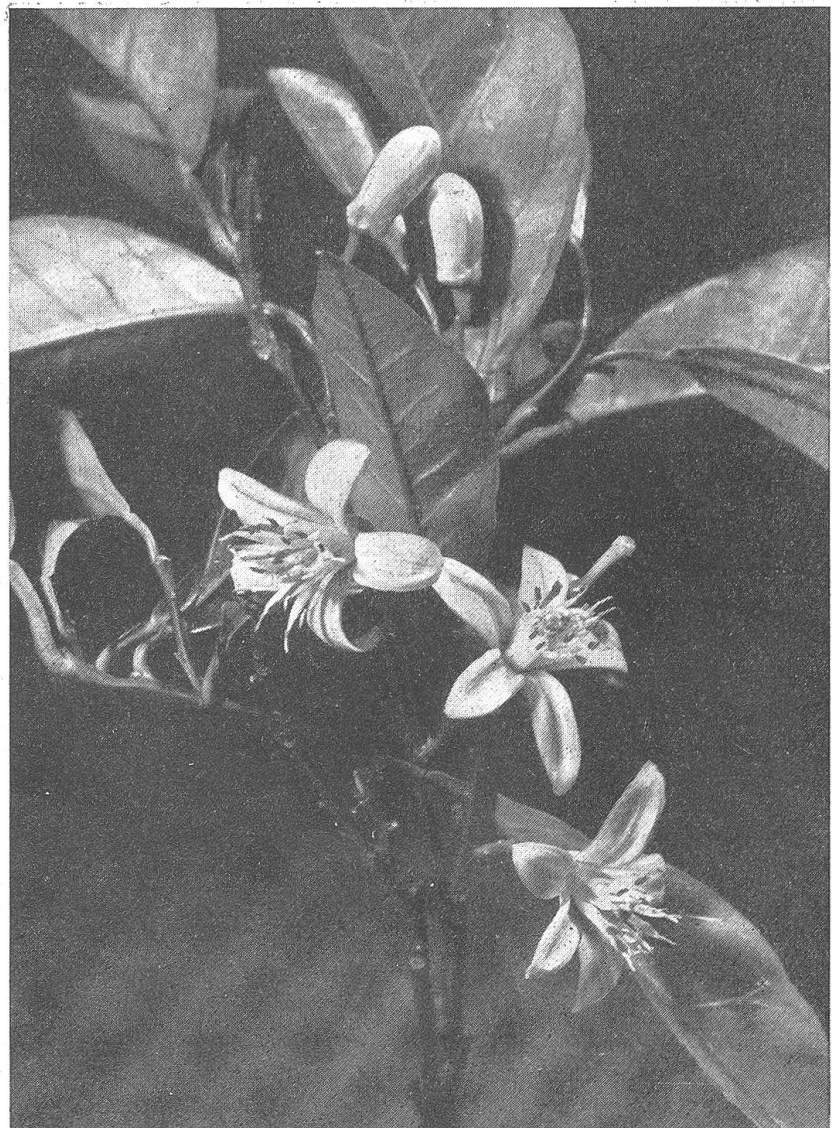
Abb. 1. Die Blüte der Bitterorange ist einer der wichtigsten Rohstoffe für die Parfümessenzenerzeugung von Grasse. Die Pflanze wird nicht wegen ihrer Früchte, sondern ausschließlich zur Gewinnung des Geruchstoffes auf weiten Anbauflächen kultiviert

Wir haben aus Paris Empfehlungen mitgebracht, die uns in die eifersüchtig bewachten und gehüteten Speziallaboratorien und Aufbereitungsräume der berühmten Parfümeriewerke Zutritt verschaffen. Einer der leitenden Ingenieure führt uns in die Geheimnisse der wohl-