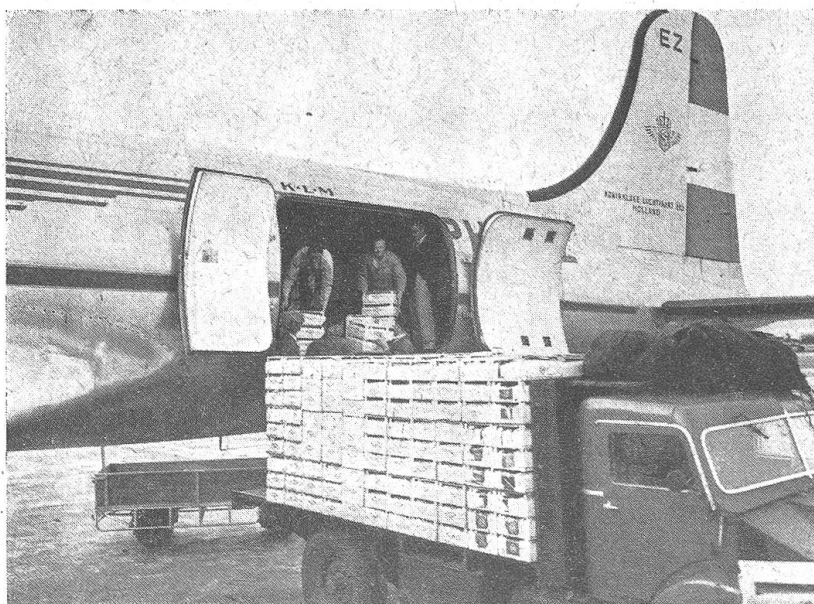
Eine Sendung Erdbeeren ist angekommen. Wenige Stunden nach der Ernte stehen sie völlig frisch dem 1000 Meilen entfernten Konsumenten zur Verfügung

Außer den zuerst genannten hochwertigen Gütern waren es vor allem leichtverderbliche Waren, die man früher schon als Luftfracht beförderte. Die prächtigen Blumen, die während der kalten Jahreszeit in den Blumenläden unserer Breiten zur Schau gestellt sind, kommen meist mittels Flugzeug aus dem Süden, ebenso die Primeurs, wie Erdbeeren und Trauben oder Frühgemüse, die alle einer besonderen Verpackung bedürfen und vielfach unterkühlt transportiert werden müssen. Ebenso überqueren monatlich mehrere Tonnen Langusten,