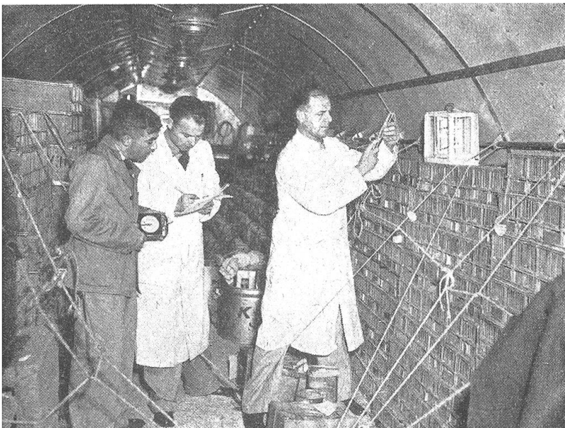
Veterinärärzte der KLM messen bei einem Transport exotischer Vögel Temperatur, Feuchtigkeit und Sauerstoffgehalt der Luft im Frachtraum

ustern und Forellen in Spezialbehältern — ische werden neuerdings in mit Wasser gefüllten, freihängenden Nylonsäcken befördert — en Ozean.