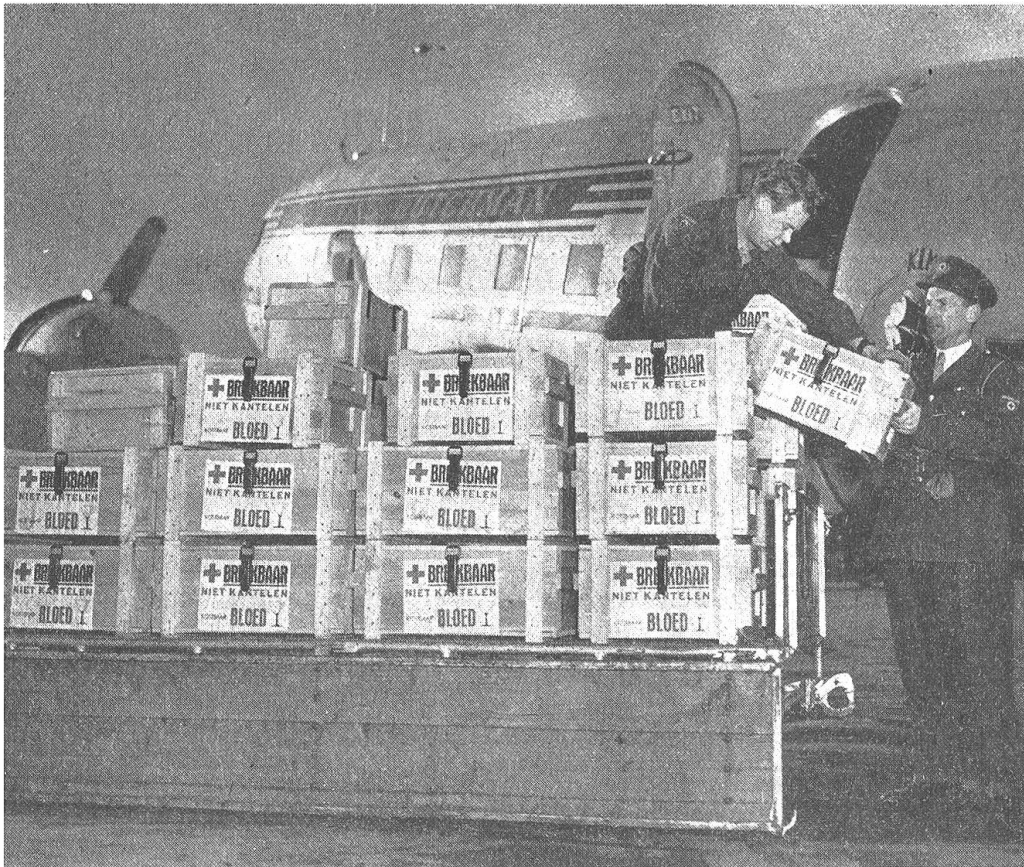
Eine besonders wichtige Luftfracht: Hier wird Blutplasma verladen, das dazu bestimmt ist, weit von Europa entfernt, in Südostasien, lebensrettend zu wirken

bringung der Tiere, ihre Fütterung und Wartung sowie für die Sicherung der Käfige zu sorgen haben. Da sich Schiphol nun zu einem Umschlagplatz für Tiertransporte entwickelte, wurde von der KLM auf dem Flugplatz ein Tierhotel errichtet und vor kurzem in Betrieb genommen. Hier