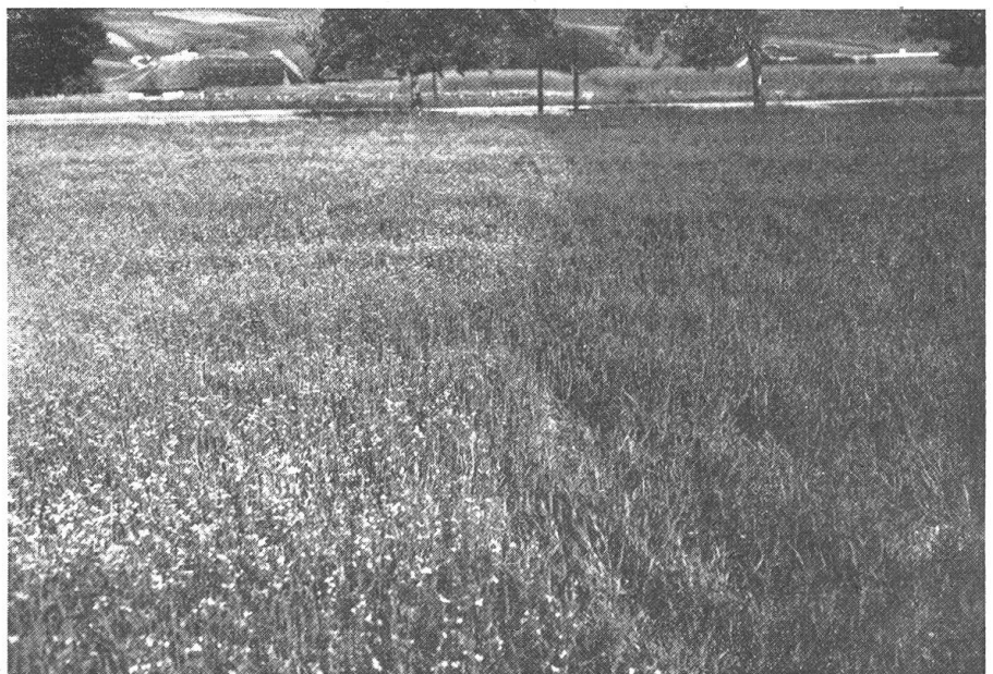
Abb. 1. Ein interessanter Versuch: Ein mit Hederich verseuchtes Haferfeld im oberösterreichischen Mühlviertel, dessen rechte Hälfte mit Dicopur gespritzt wurde. Der Hederich ist aus dem Feldbestand verschwunden. Links sieht man die unbehandelte Fläche. Der Hederich steht dort in voller Blüte

Bei näherer Untersuchung zahlreicher, den pflanzeneigenen Hormonen verwandter Stoffe zeigte es sich, daß bei Anwendung eines dieser synthetischen Wuchsstoffe, der 2,4-Dichlorphenoxyessigsäure (2,4-D), nur bei gewissen Pflanzen die oben beschriebenen Auswirkungen eintraten. Diese „selektive“ Wirkung von 2,4-D ermöglichte es, Getreidefelder, Wiesen und Almen vom Unkraut zu befreien. Während die zweikeimblättrigen (dikotylen) Pflanzen, zu welchen die häufigsten Unkräuter zählen, durch Versprühung von „Dicopur“, dem neuartigen Hormonpräparat auf 2,4-D-Basis, welches die Linzer Stickstoffwerke herstellen, sich „zu Tode atmen“, bleiben die Getreidepflanzen und Gräser ohne jede Schädigung. Die rechtzeitige Unkrautbekämpfung im Getreidebau sichert den Kulturpflanzen eine reichliche Versorgung mit den im Boden vorhandenen Nährstoffen und verhindert den Lichtentzug durch die auf Kosten der Getreidepflanzen lebenden Un-