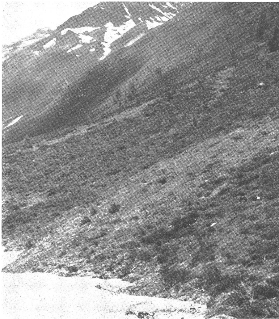
Abb. 4. Eine Hochalm im Defreggental (Osttirol). Dieses Bild zeigt deutlich, wie hier durch Überhandnehmen der Alpenrosen jeder üppige Graswuchs unterbunden wird

Kaine der Roggenfelder und bietet einem pilzlichen Parasiten des Getreides, dem Getreiderost ( Puccinia graminis ), eine willkommene Gelegenheit der Überwinterung. Dieser Pilz, welcher sich während der Vegetationsperiode des Getreides an den Halmen festsetzt, wird mit Eintreten der Roggenernte obdachlos. Die Sporen werden vom Wind auf die benachbarte Berberitze übertragen und überdauern dort — gut geschützt — den Winter. Auch hier wurde der Versuch unternommen, durch Bespritzung der Berberitzensträucher mit Dicopur Abhilfe zu schaffen. Diese Versuche sind noch nicht abgeschlossen, doch zeigt sich schon jetzt, daß die Berberitze schwer geschädigt wird. Durch diese Maßnahme wird dem Pilz die Überwinterungsmöglichkeit genommen, und die Roggenfelder des Lungau werden, wenn die Bekämpfung der Berberitze vollständig gelöst sein wird, wieder vollwertige Ernten bringen.