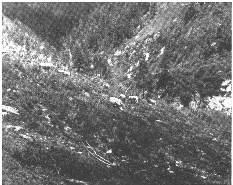
Abb. 3. Weidevieh auf einer Hochalm in Osttirol. Nur mühsam findet das Vieh sein spärliches Futter, da die Alm stark mit Alpenrosen verwachsen ist

Abschließend sei noch eine Pflanze erwähnt, welche in vielen Gebieten der Ostalpen, z. B. im Lungau, einen Feind der Getreidefelder darstellt, die Berberitze ( Berberis vulgaris ). Dieser Strauch umsäumt häufig die