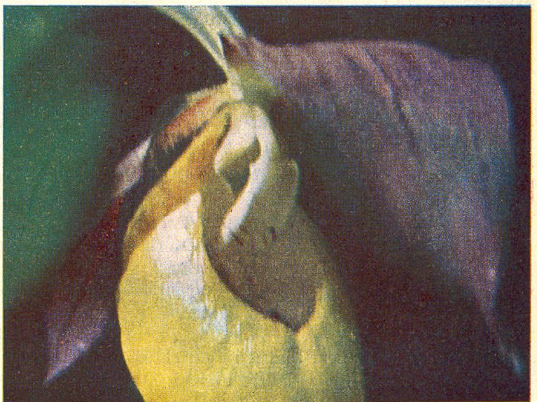
Abb. 4. Die auffallend gelbe Frauenschuhlippe lockt Insekten an, die glatten Innenwände verhindern seitliches Hochkriechen