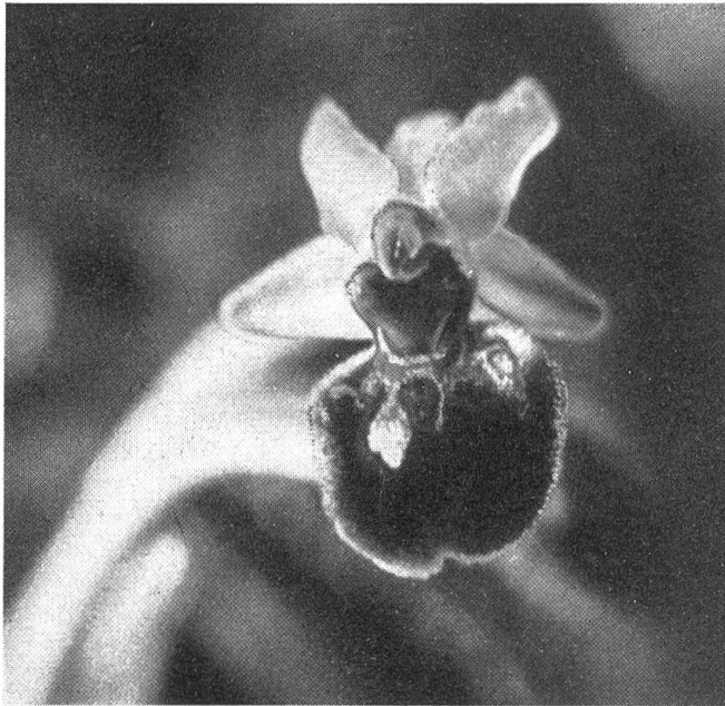
Abb. 5. Die Blüte der Spinnenragwurz ( Ophrys araniifera )

speculum in Algier führten zu dem überraschenden Ergebnis, daß die Männchen der dort vorkommenden Dolchwespe Dielis ciliata einen Monat vor dem Weibchen schlüpfen; die Männchen besuchen nun in ihrer „Freizeit“ diese Blüte und benehmen sich hierbei ganz seltsam, sie zittern und geraten in krampfartige Bewegung gerade wie bei geschlechtlicher Vereinigung; nach dem Auskriechen der Weibchen kümmern sich die Männchen um diese, nicht mehr aber um noch verspätete Blüten von Ophrys speculum .