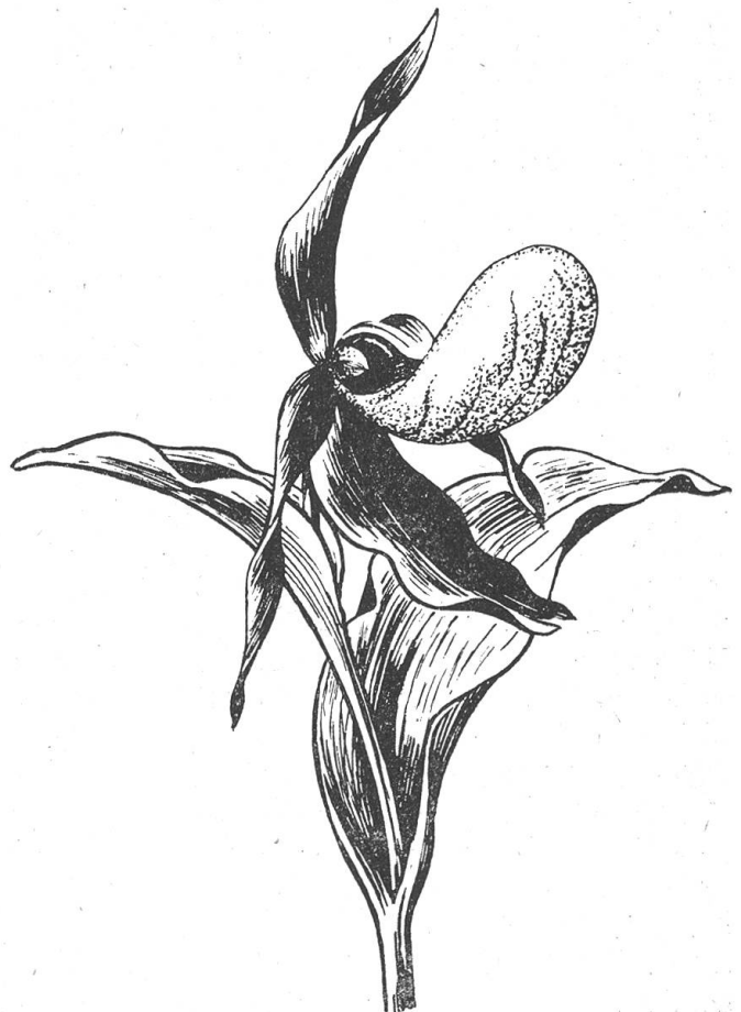
Abb. 1. Der Frauenschuh ( Cypripedium calceolus ), unsere schönste einheimische Orchidee

Mühe machen, die Blüte im einzelnen zu betrachten: der innere Kreis entspricht den drei inneren Blumenkronblättern der Liliazeen — auf deren Verwandtschaft zu den Orchideen nebenbei schon Goethe hingewiesen hat —, mit der leuchtend gelben Lippe in Schuhform und den rechts und links seitlich oben befindlichen schmalen, braunvioletten, weiteren zwei inneren Blumenkronblättern, den „Petalen“. Die drei äußeren Blumenkronblätter, „Sepalen“ genannt, sind deutlich in ihrer Anlage zu erkennen, eines gerade oben und zwei zusammengewachsene unten, beim Frauenschuh den zwei inneren Petalen sehr ähnlich (Abb. 1).