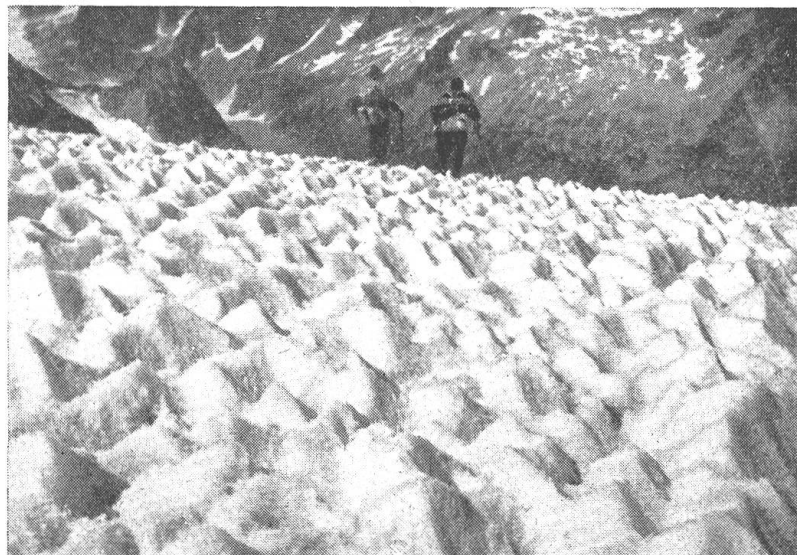
Abb. 3. Zuckerhutfirn, August 1935, am Passo Casnil (Bergell)

gone, vor. In den von den Rissen umgrenzten Bodenstücken hält die Kapillarkraft das Material zusammen.