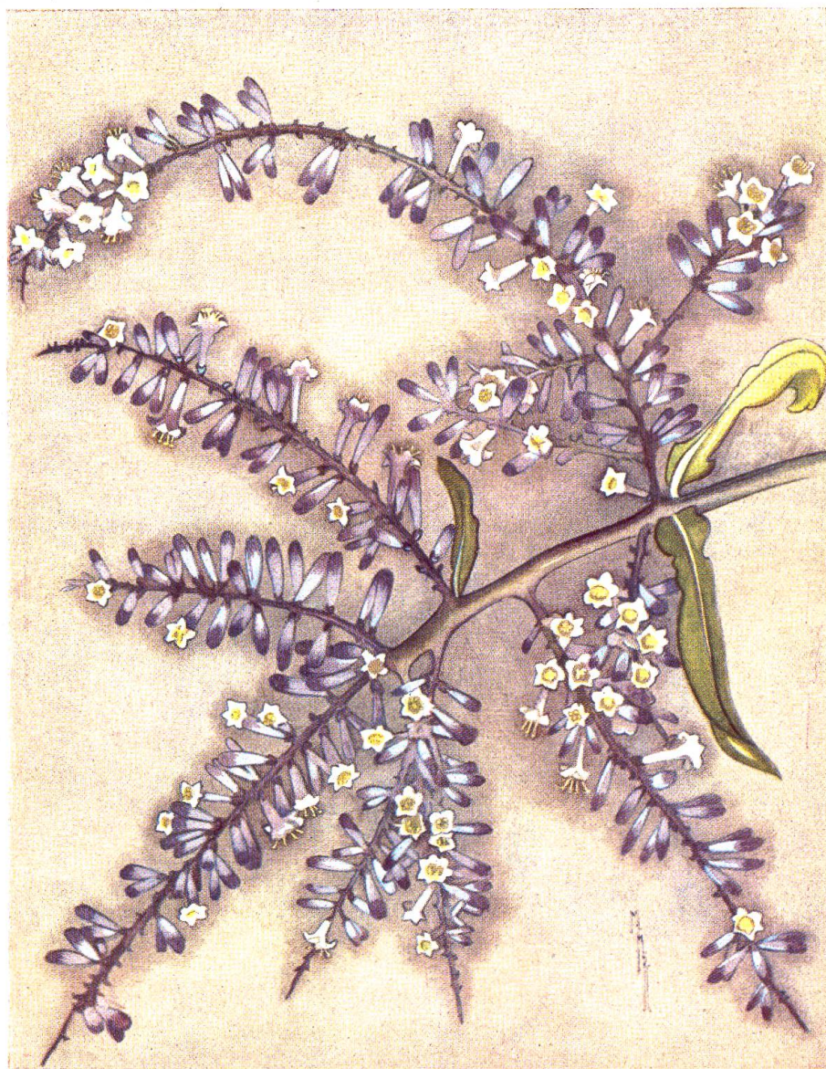
Die sogenannte Ti-Blüte ( Cordyline terminalis ) wurde seinerzeit für die Anfertigung der „Hula-Röcke“ verwendet. In den Blättern dieser Pflanze bereitet man Fleisch und Fisch für das Luau, das hawaiische Festmahl

Welches sind aber nun typisch hawaiische Blumen? Es gibt ihrer viele, aber wenige sind den Laien bekannt, da man sie gewöhnlich nur im engeren Bereich der vulkanischen Ge-