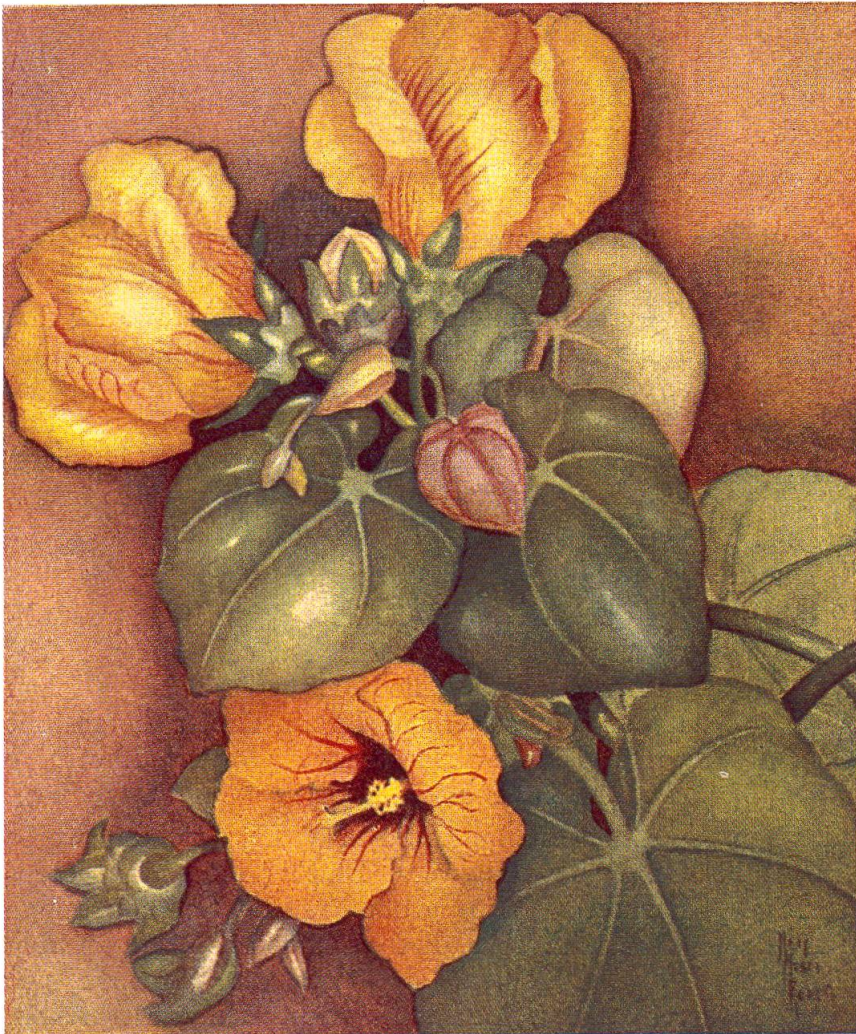
Die Hau-Blüten wachsen an einem rankenartigen Baum (Hibiscus tiliaceus) und zeigen die bekannte Form der Hibiskusblüten (Die Farbbilder zu diesem Beitrag wurden nach Originalaquarellen der Verfasserin hergestellt)

Unter den Passionsblüten (Passiflora) mit ihrem kühlen, frischen Duft und den blanken, zackigen Blättern findet man verschiedene Arten, von denen etliche von Südamerika, andere von Australien auf die Inseln verpflanzt worden sind. Besonders hübsch ist die Passiflora