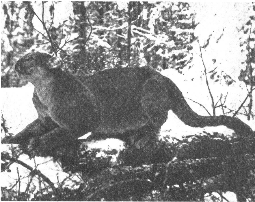
Ein Silberlöwe im winterlichen Wald der nordamerikanischen Pazifikküste