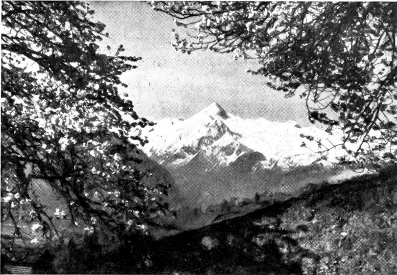
Strahlender Frühsommer war es, als unsere Wanderfahrt „Zwischen den Jahreszeiten“ begann. Im Hochtal blühten die Obstbäume, von den Gipfeln blinkte der schimmernde Neuschnee. (Blick von der Schmittenhöhe gegen die Hohen Tauern)

jederzeit zwischen März und August zu genießen, wann immer wir es wünschen, fällt dagegen nicht schwer. Stufe um Stufe nur steigt er langsam die Hänge empor, nicht mehr als durchschnittlich 10 bis 15 Höhenmeter täglich. Bis er endlich die Grenzen des ewigen Eises erreicht hat, ist in den Tälern längst das Korn geschnitten und reift das Obst.