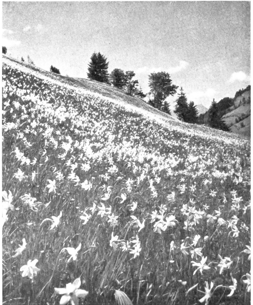
Mit der Narzissenblüte vollzieht sich im Alpenvorland die Wandlung vom Frühling zum Frühsommer. (Salzkammergut)

legenen Wintersportplätzen die Skisaison noch lange nicht zu Ende ist. Doch bald ist im Tal der Frühling wieder vorbei. Wollten wir ihn auf seinem Weg nach dem Norden auf den Fersen bleiben, wir müßten Tag um Tag marschieren, um gleichzeitig mit ihm etwa Anfang August das Nordkap zu erreichen. Mit dem Alpenfrühling Schritt zu halten, ihn