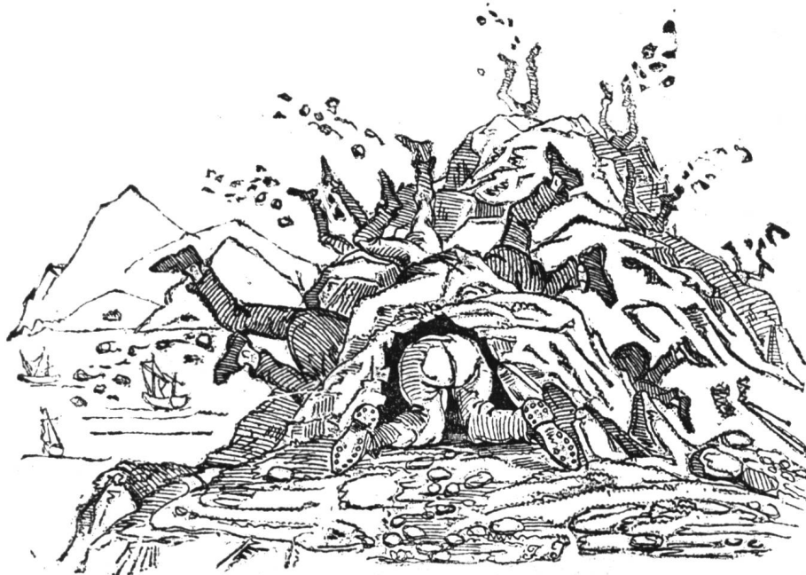
Ansicht von Kalifornien.