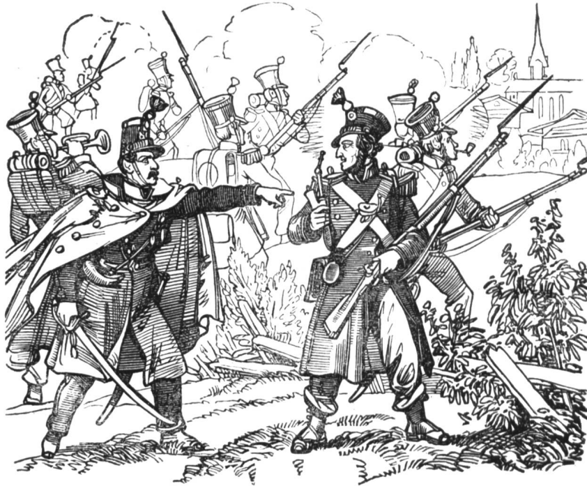
1) Der rauchende Plänkler. — 2) Die salutirende Eskafette.

Inhalt: Erstes Auftreten der Jesuiten und des Nuntius in der Schweiz, mit 2 Abbildungen. — Adam von Camogast, mit 2 Abbild. — Das Erdbeben von 1356, mit 2 Abbild. — Der gebesserte Kettensträfling. (Eine wahre Geschichte.) — Der Schweizer Einheitskampf und das Jahr 1848, mit 23 Abbild. — Bundeslied, mit 1 Abbild. — Contraste aus dem schweizerischen Soldatenleben. (Wahre Bilder a. d. Sonderbundskrieg.)