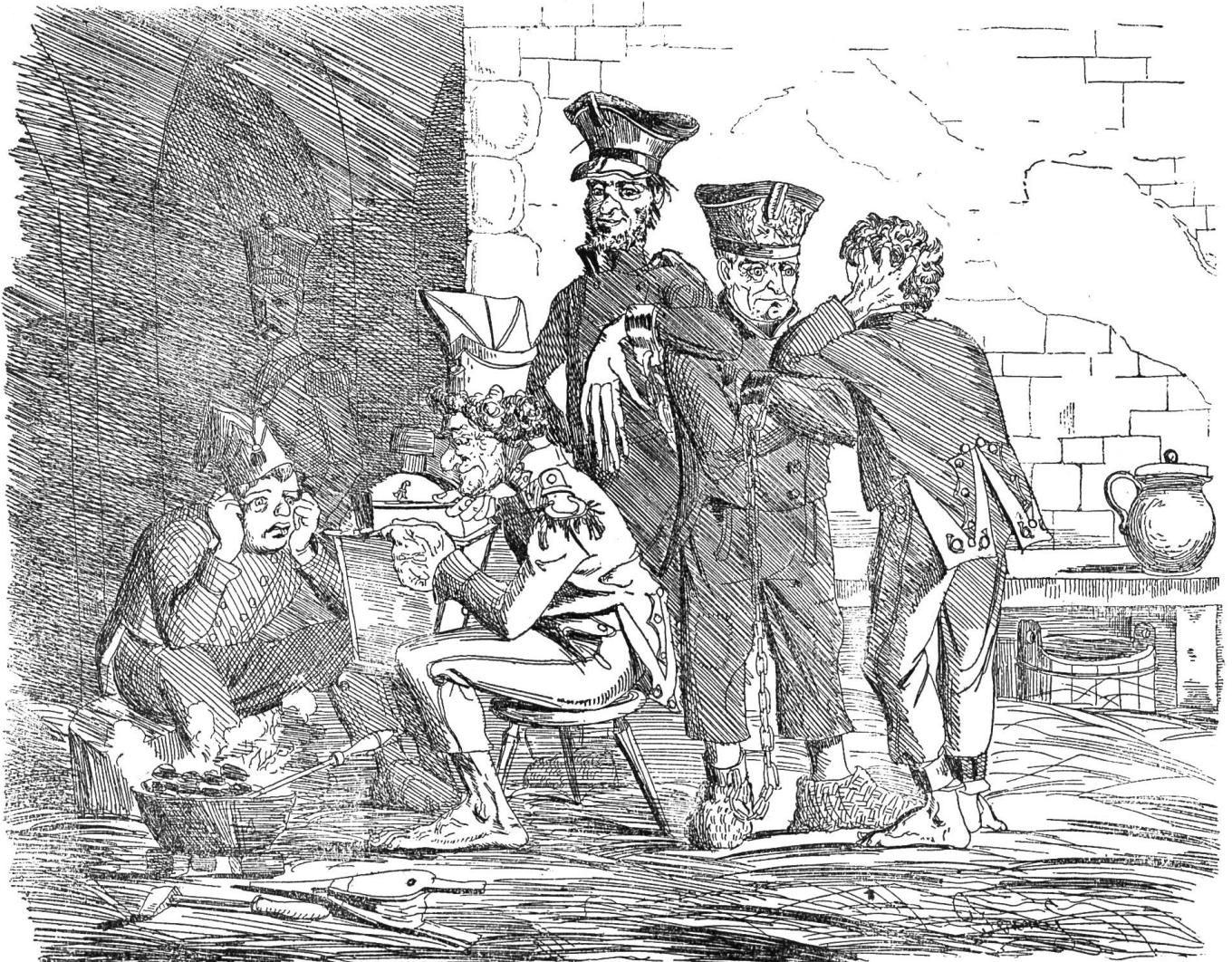
Neues, patentirtes Mittel der Nidwaldner Militärbehörden die Scharfschützen-Uniformen vor Rost und Motten zu bewahren.