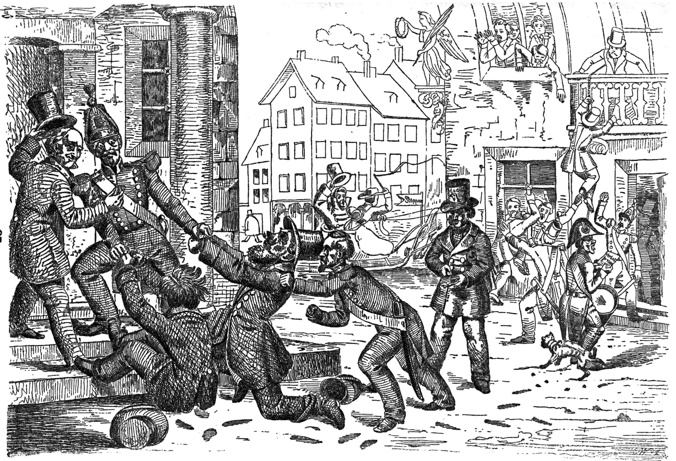
Als wie so der Präsident des Großen Rathes von Tessin es möglich zu machen sucht, die Traktanden zu erledigen.