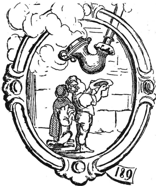
№ 189. Wie ein Meerschäum auf höchst rührende Weise angebettelt wird.