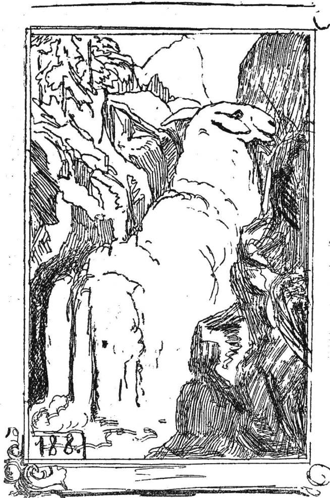
№ 188. Dem Anfertiger dieses Wasserfalls ist wahrscheinlich ein Bergamaskerschaf als Modell gestanden.

Es thut uns von Herzen Leid wegen Mangel an Raum diese Blumenlese nicht reichhaltiger machen zu können. Wir hätten noch mit einer hübschen Anzahl von Atlasgeyern (Nr. 45, 319, 320), ungewaschenen Heiligen (Nr. 4, 5, 194, 206), jungen Nürnbergertannen unter denen der unbarmherzige Boreas wüthet (Nr. 391) unheimlichen Winterlandschaften, bei deren Anblick man unwillkürlich nach Handschuhen und Ueberziehern sucht, und grasgrünen Alpenstücken mit Ziegen, welche auf die nächsten vakanten Plätze im Thierhospital aspiriren, aufwarten können. Auf Wiedersehen das nächste Jahr! —