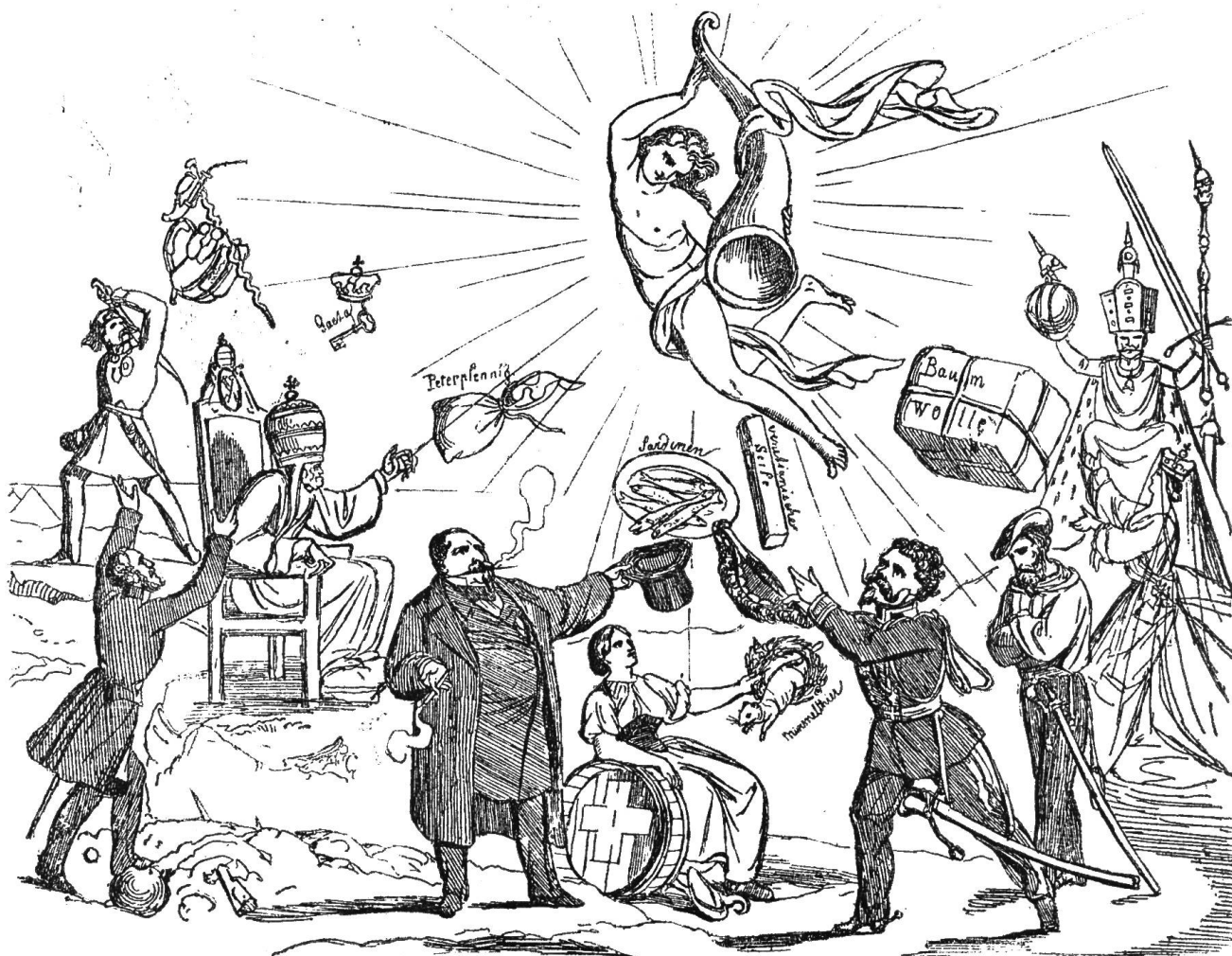
Was das Neujahrskindlein den verschiedenen europäischen Potentaten als Neujahrsgeschenk bringt.