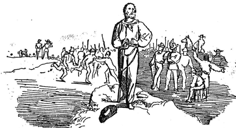
Und wie diese Erfolge in Wirklichkeit sind.