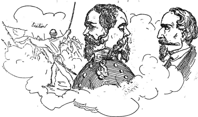
Wahrhaftige Abbildung des Gesichtes, das Viktor Emanuel bei der Nachricht von Garibaldi's Ankunft in Sizilien machte gegen Garibaldi selber. gegen den Kaiser Napoleon.