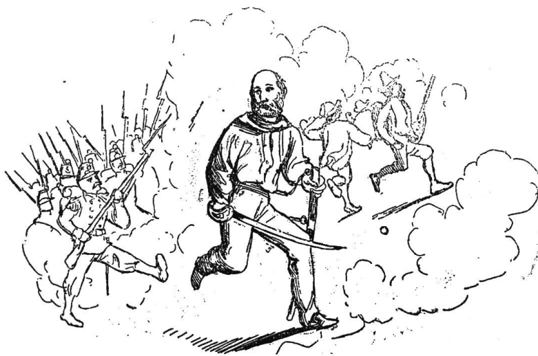
Wie die Turiner-Zeitungen die Erfolge Garibaldi's in Sizilien darstellen.