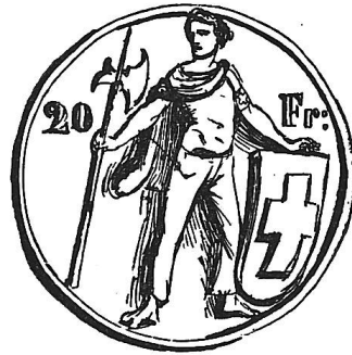
| Apollo von Belvedere.