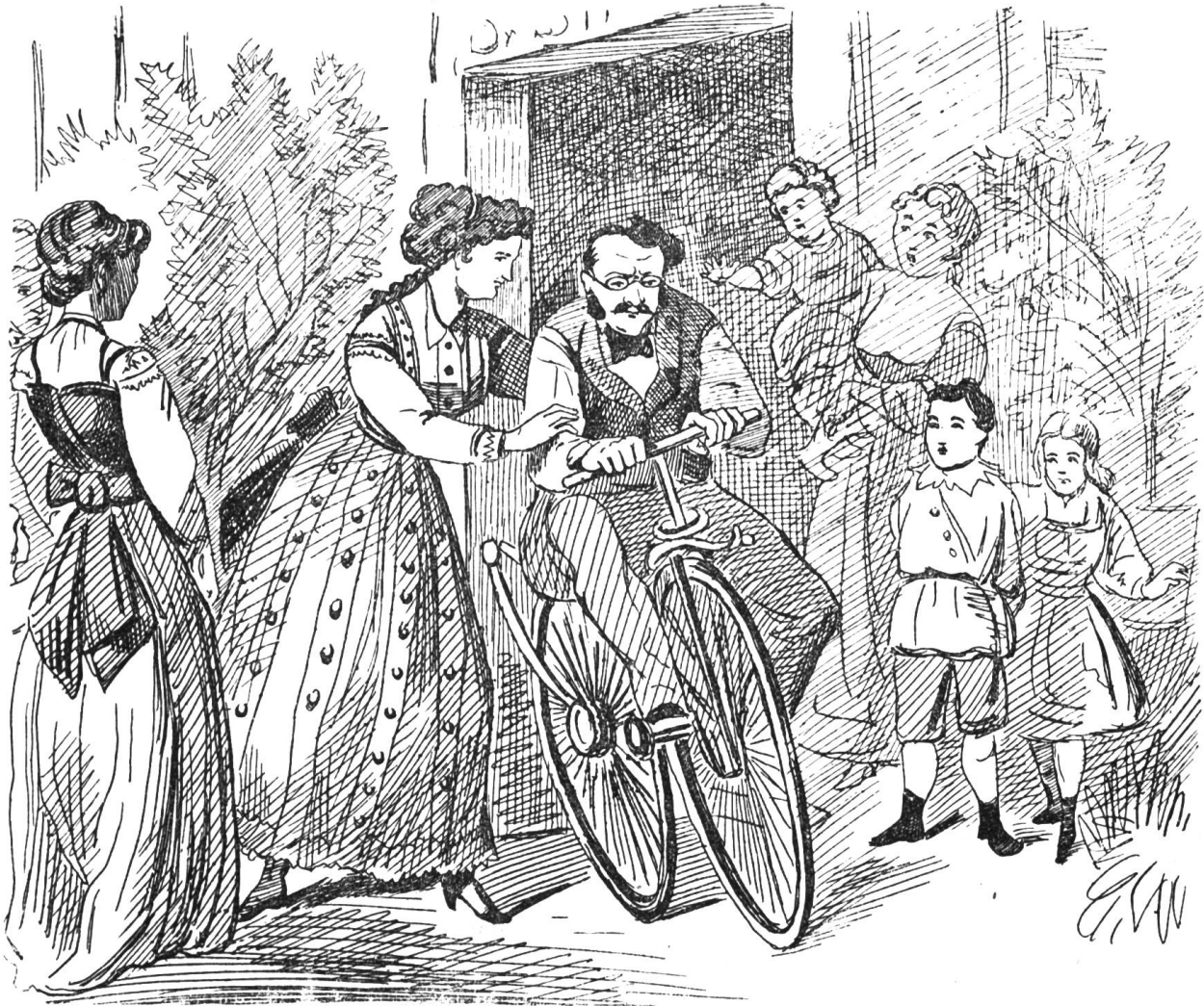
Papa läßt sich von Frau Gemahlin und Fräulein Töchtern im Velocipede-Fahren unterrichten.