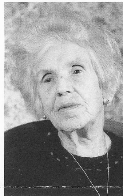
Volle Zugehörigkeit ist wichtig für hochaltrige Menschen

Pionierin und Dienstleisterin: Beide Rollen waren konstitutiv in der Geschichte von Pro Senectute – sie werden es auch in der kommenden Gesellschaft des langen Lebens bleiben. Wenn die Stiftung Pro Senectute bereit ist, diese Rollen immer neu anzunehmen und weiter auszufüllen – engagiert, kreativ, kraftvoll – wird sie ihren wichtigen Platz in unserer Gesellschaft behalten und ihre spezifischen Aufgaben gut erfüllen. Und ich bezweifle nicht, dass diese Bereitschaft besteht. MZ/kas