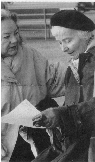
Frauen brauchen soziale Kontakte ...