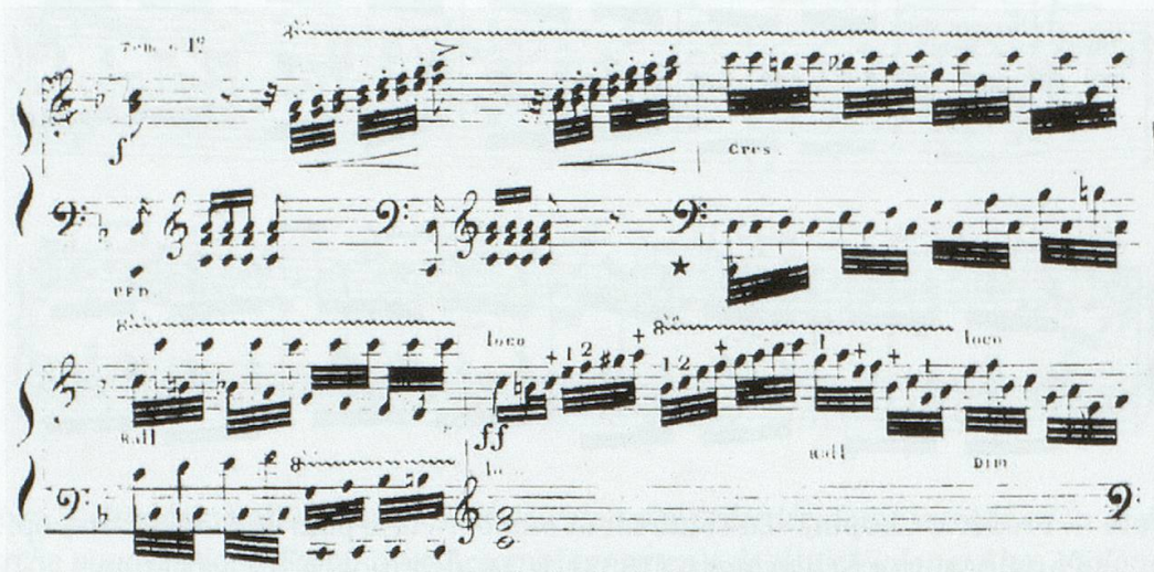
Figure 6. Frédéric Kalkbrenner, Effusio musica , Grande Fantaisie , op. 68, Paris, Henry Lemoine, [1823], Molto adagio e espressivo , p. 18.

de sa fantaisie Effusio musica , op. 68, publiée la même année que le Grand Concerto , op. 61 :