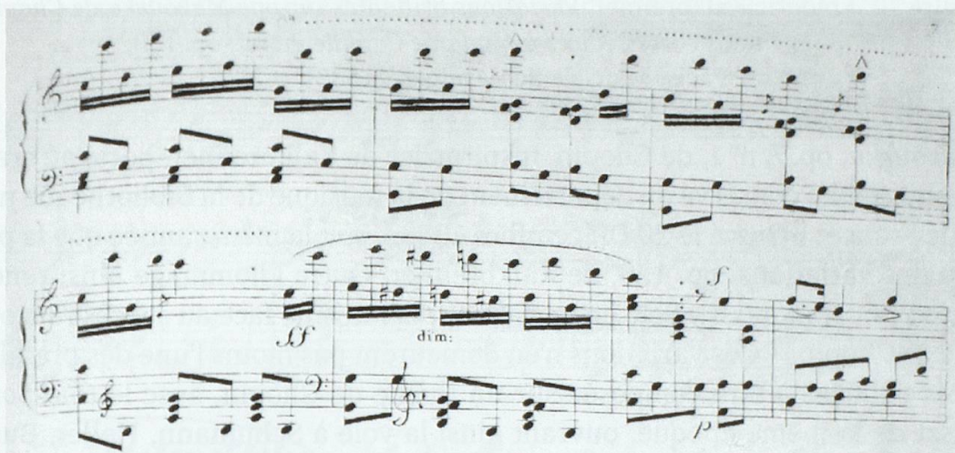
Figure 8. Frédéric Kalkbrenner, Troisième Concerto [...], op. 107, Paris, Aulagnier, [1829], I. All.º moderato , 1 er solo, 2 e thème principal, p. 6-7 (partie de piano).