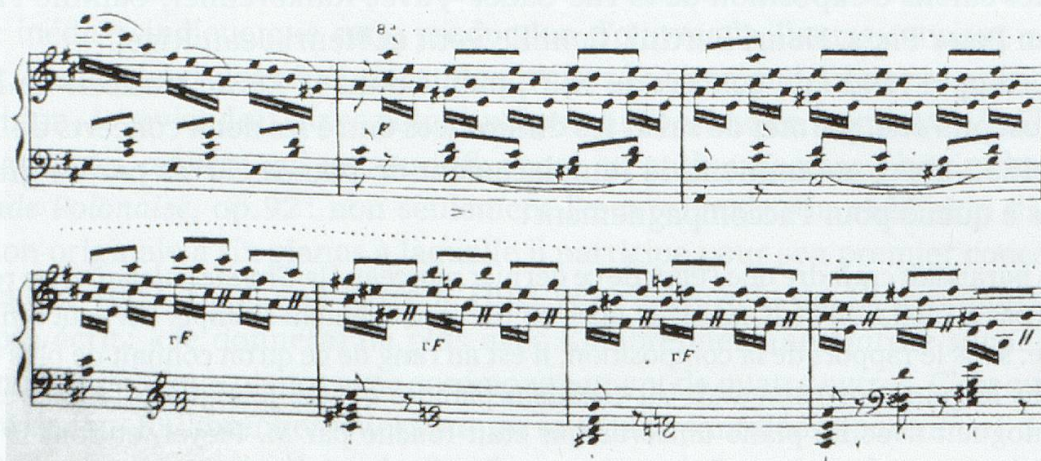
Figure 3. Frédéric Kalkbrenner, Grande Polonaise précédée d'une Introduction et d'une Marche pour le Piano-Forté, avec Accomp[agnemen]t de deux Violons, Alto, Violoncelle et Contre-Basse ad libitum, dédiée à S. M. Nicolas, Empereur de toutes les Russies , op. 92, Paris, Pleyel, [1828], p. 18 (partie de piano).

Voici ce trait de la p. 22 signalé par Fétis, pris ici dans l'édition originale :