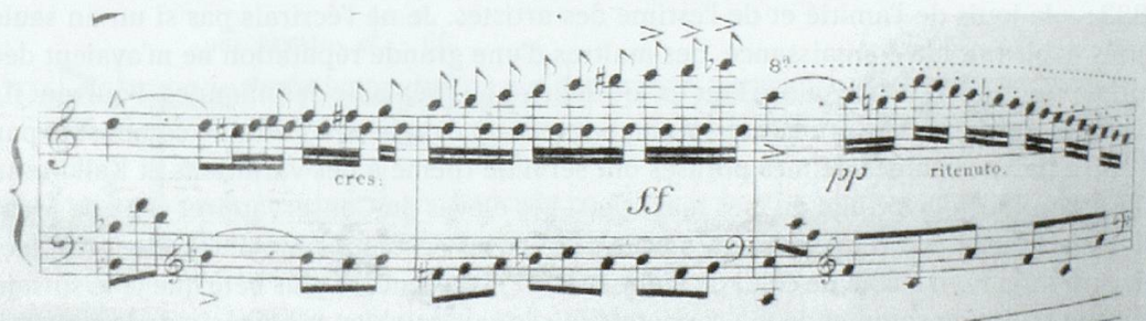
Figure 9. Ibid. , I. All.º moderato , section centrale, p. 12 (partie de piano).