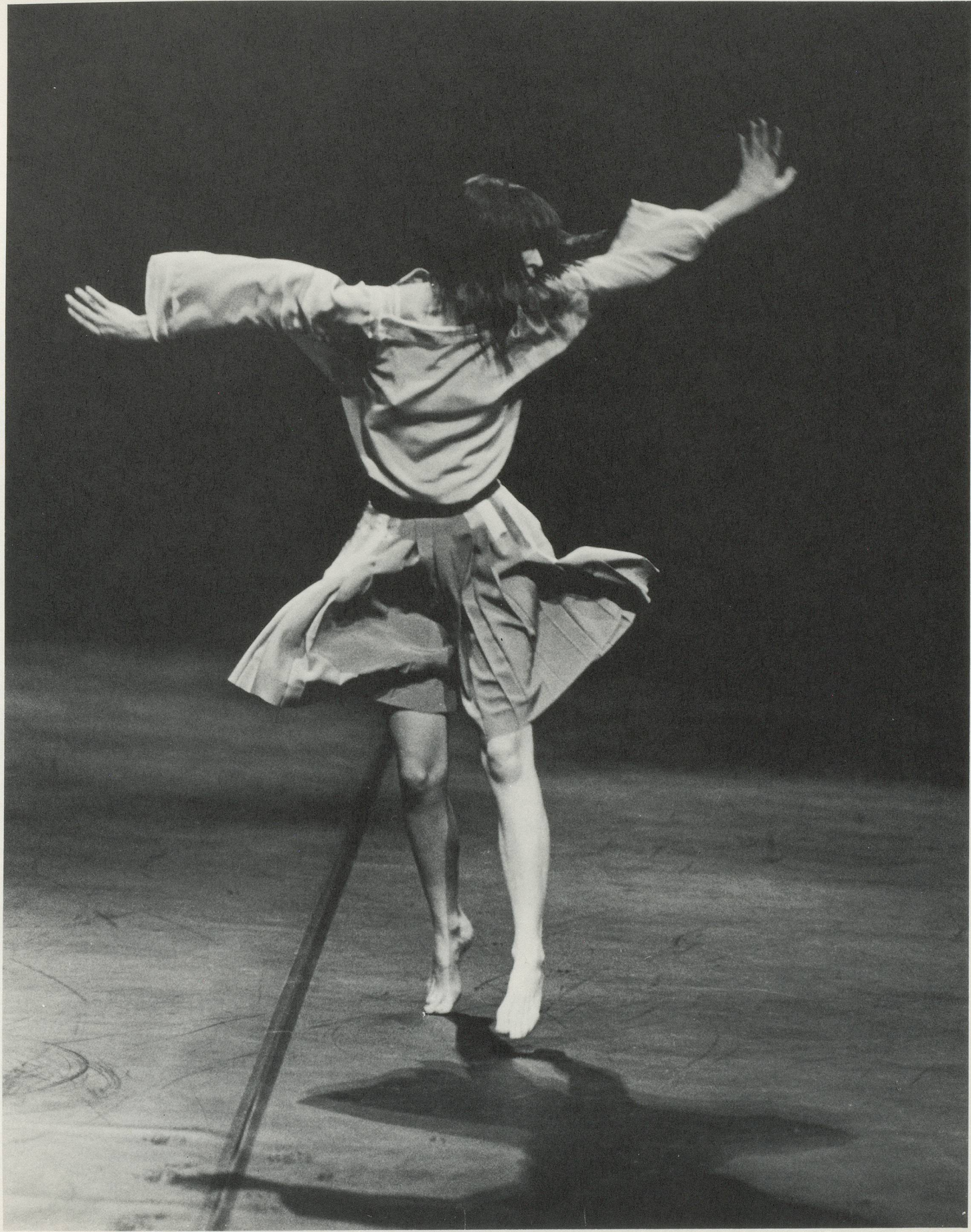
«Field Papers», 1983