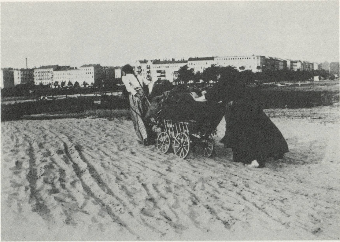
HEINRICH ZILLE, Zwei Frauen bei der Heimkehr aus Grunewald, Berlin, ca. 1900 / Two women returning from the Grunewald, Berlin, ca. 1900.