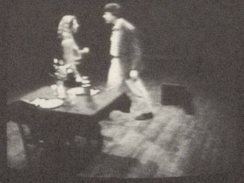
BRUCE NAUMAN, VIOLENT INCIDENT, 1986, VIDEO TAPE FOR PARKETT, DE LUXE EDITION PARKETT NO. 10