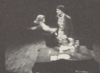
BRUCE NAUMAN, GEWALTÄTIGER ZWISCHENFALL, 1986, VIDEO TAPE FÜR PARKETT, VORZUGSAUSGABE PARKETT NR. 10