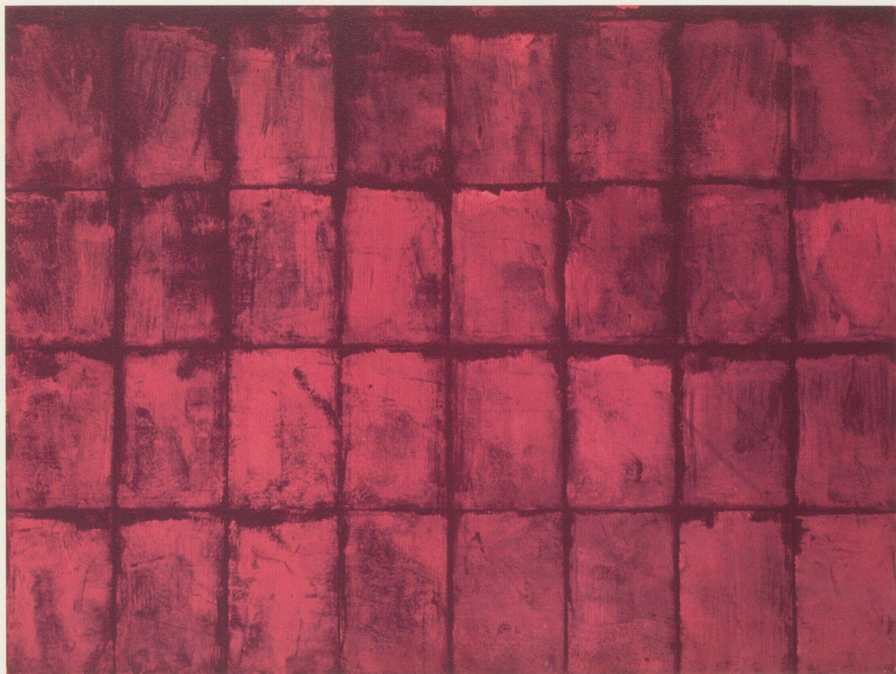
BRICE MARDEN, UNTITLED / OHNE TITEL , 1964-65, OIL ON CANVAS / ÖL AUF LEINWAND , 20 \frac{3}{4} x 27 \frac{3}{4} " / 53 x 70 CM.