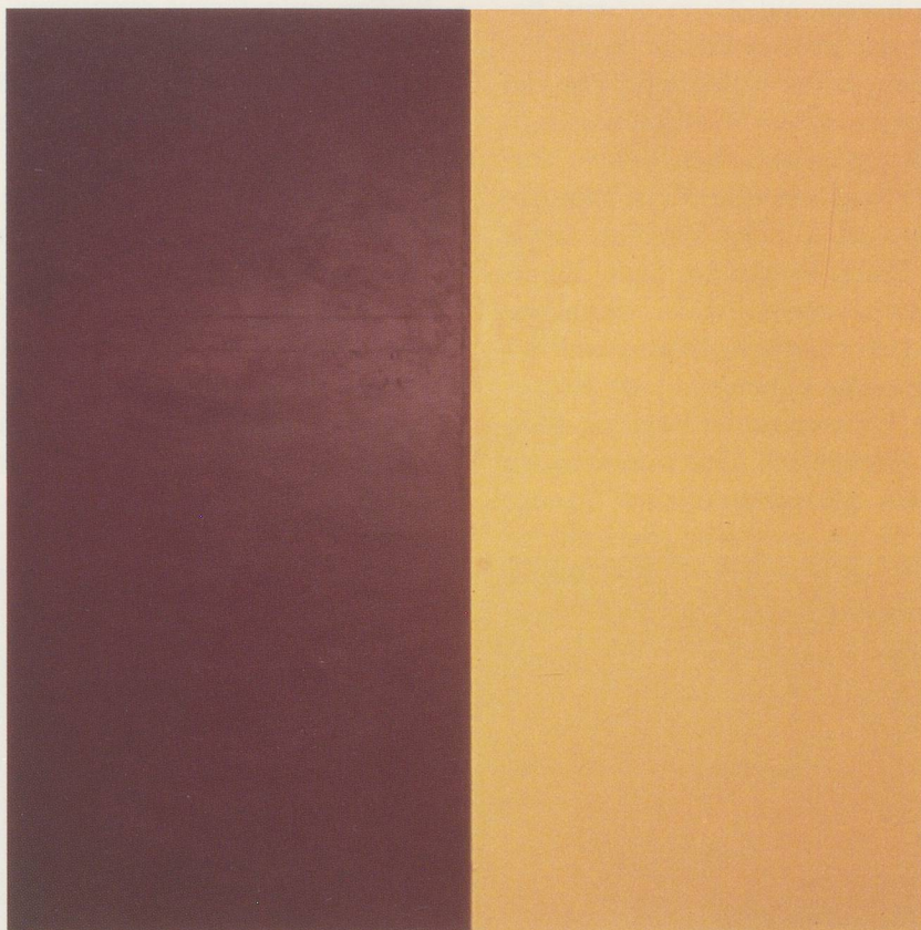
BRICE MARDEN, RODEO, 1971, OIL AND WAX ON CANVAS / ÖL UND WACHS AUF LEINWAND, 96 x 96" / 244 x 244 CM.