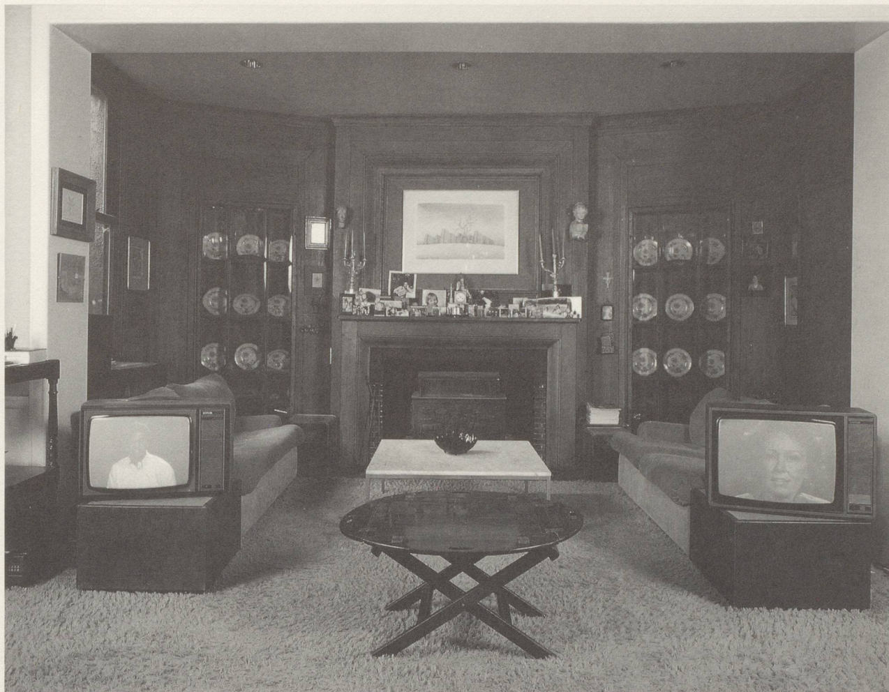
BRUCE NAUMAN, GOOD BOY / BAD BOY, INSTALLATION FOR THE EXHIBITION «CHAMBRES D'AMIS» IN THE HOUSE OF / INSTALLATION FÜR DIE AUSSTELLUNG «CHAMBRES D'AMIS» IM HAUS VON SERWEYTENS DE MERCKA, MONTERREYSTRAT 13 IN GENT.