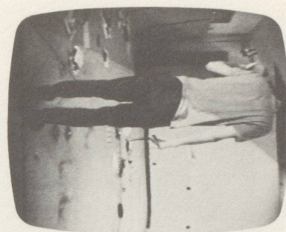
BRUCE NAUMAN, VIOLIN TUNED D,E,A,D / VIOLINE, GESTIMMT D,E,A,D (TOT), 1968, B/W, 60 MIN., SOUND.

BN Für Bahnhöfe bzw. Untergrundstationen. Innenaufnahmen von aussen, oder Aufnahmen von Leuten an einer anderen Haltestelle; oder die gleichen Räumlichkeiten, aber andere Leute. Bei manchen Installationen war vorgesehen, um die Ecke zu gehen, so dass man sehen konnte, was sich dort abspielte. Man konnte also zum Beispiel jemanden hinausgehen sehen, aber es war unmöglich, sich selbst beim Betreten oder Verlassen des Raumes zu beobachten.