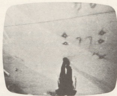
BRUCE NAUMAN, STAMPING IN THE STUDIO / STAMPFFEN IM ATELIER, 1968, B/W VIDEO TAPE, 60 MIN., SOUND

BN Die Filme waren im Prinzip dasselbe wie die Videos. Da spielt auch die Verfügbarkeit der Geräte eine Rolle. Als ich in San Francisco lebte, gab es