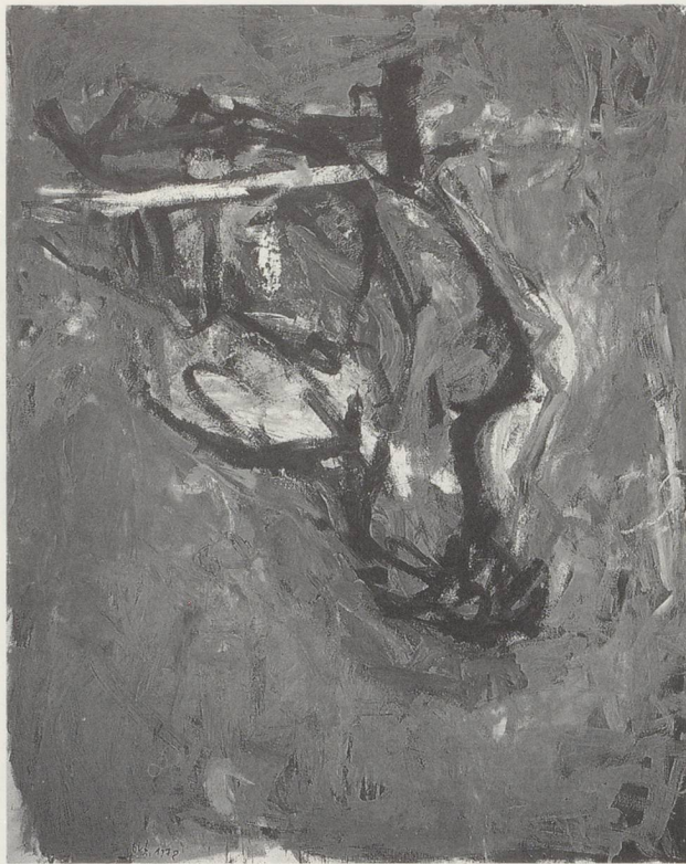
GEORG BASELITZ, AKT UND ADLER / NUDE AND EAGLE, 1978, ÖL AUF LEINWAND / OIL ON CANVAS, 2-TEILIG / IN 2 PARTS, JE 250 x 200 CM / 8'2 \frac{1}{2} " x 6'6 \frac{1}{4} " EACH. (ZÜRICH, SAMMLUNG MGB / FMC COLLECTION)