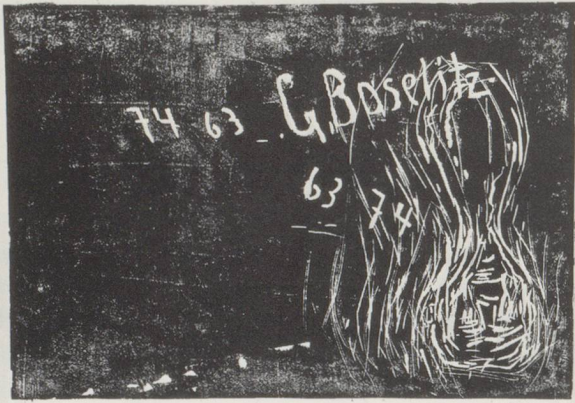
GEORG BASELITZ, HOLZSCHNITT FÜR DEN UMSCHLAG DER LUXUSAUSGABE DES / WOODCUT FOR THE COVER OF THE DELUXE EDITION OF: WERKVERZEICHNIS DER DRUCKGRAPHIK 1963-1974, BERN-BERLIN 1983. (GENÈVE, CABINET DES ESTAMPES)

Das Thema der Träne erscheint bei Baselitz im Anschluss an die PASTORALEN von 1985-1986, in denen er nicht nur Erinnerungen an seine Kindheit in Sachsen, sondern auch Produktionen aus den sechziger Jahren neu verarbeitet. Er hat in seiner neueren Malerei meines Wissens mindestens dreimal auf das Tränenmotiv zurückgegriffen. 13 In TRÄNEN erzeugt die Formulierung der Tropfen ein