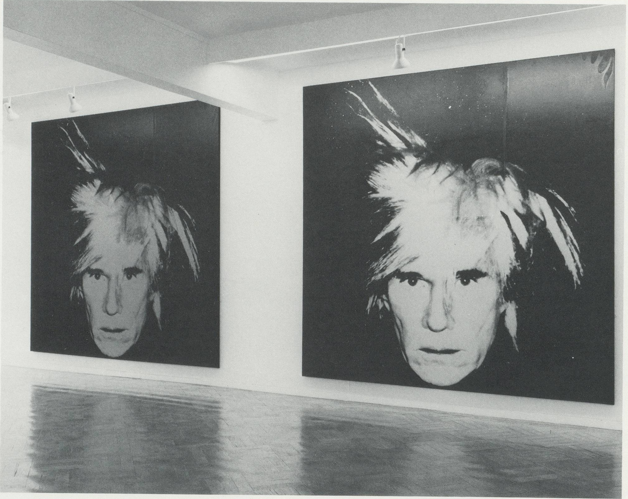
ANDY WARHOL, SELFPORTRAITS 1986, INSTALLATION VIEW, ANTHONY D'OFFAY GALLERY, LONDON, SPRING 1986