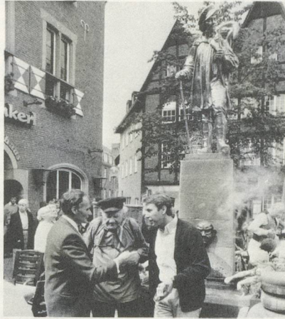
JEFF KOONS, REPLIK DES «KIEPENKERLS» IN ROST- FREIEM STAHL / REPLICA OF THE "KIEPENKERL" IN STAINLESS STEEL, 1987 IN MÜNSTER.

practical basis using the city of Münster as an example and involving exemplary co-operation between artists, the authorities and inhabitants. Furthermore, this was an issue which the city and communal authorities, together with all their committees, had been struggling with fruitlessly for decades. Suddenly new light was thrown on the tiresome theme "Art for public buildings" and