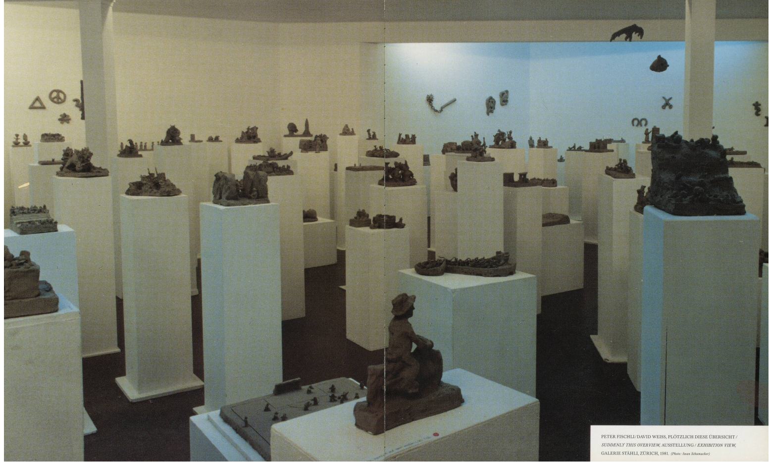
PETER FISCHLI/DAVID WEISS, PLÖTZLICH DIESE ÜBERSICHT / SUDDENLY THIS OVERVIEW, AUSSTELLUNG / EXHIBITION VIEW, GALERIE STAHL, ZÜRICH, 1981.