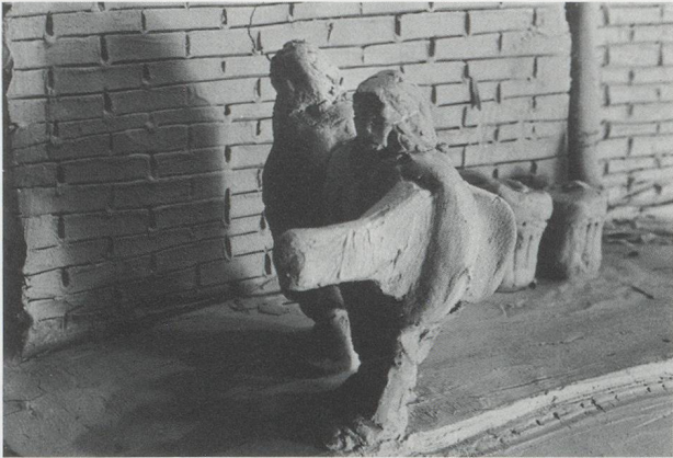
PETER FISCHLI/DAVID WEISS, MICK JAGGER UND BRIAN JONES BEFRIEDIGT AUF DEM HEIMWEG, NACHDEM SIE I CAN'T GET NO SATISFACTION KOMPONIERT HABEN / MICK JAGGER AND BRIAN JONES GOING HOME SATISFIED AFTER COMPOSING I CAN'T GET NO SATISFACTION.