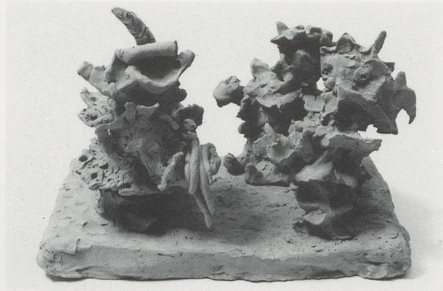
MARCO POLO ZEIGT DEN ITALIENERN ZUM ERSTEN MAL DIE AUS CHINA MITGEBRACHTEN SPAGHETTI / MARCO POLO SHOWS THE ITALIANS SPAGHETTI, BROUGHT BACK FROM CHINA, FOR THE FIRST TIME.

MINISKIRT, THE FIRST FISH DECIDES TO GO ASHORE, MICK JAGGER AND BRIAN JONES GOING HOME SATISFIED AFTER COMPOSING 'I CAN'T GET NO SATISFACTION,' CHRIST ON THE CROSS, MARCO POLO SHOWS THE ITALIANS SPAGHETTI, BROUGHT BACK FROM CHINA, FOR THE FIRST TIME. An absolute system could never be imposed on this infinite dispersion. Fischli/Weiss shake their heads in disbelief; suddenly it all makes sense only as an ironic comment on the impossibility of bringing things under control. Since then, Fischli/Weiss have continued to refine their concept of infinite dispersion.