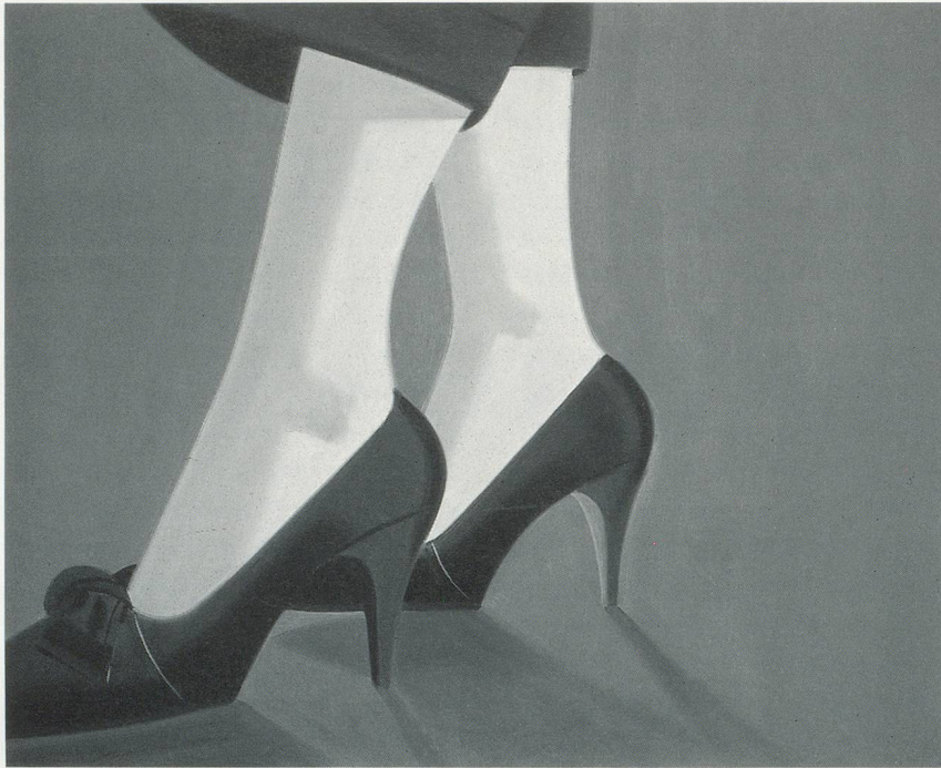
ALEX KATZ, ADA'S BLACK PUMPS/ ADAS SCHWARZE STÖCKELSCHUHE, 1987, OIL ON CANVAS/ ÖL AUF LEINWAND, 48 x 60 "/ 122 x 152 cm.

anlasst, die Offenkundigkeit in den Werken selbst zu vernachlässigen, um eine tiefere, verborgene, unglückliche Bedeutung unter ihren manierlichen Oberflächen zu suchen.