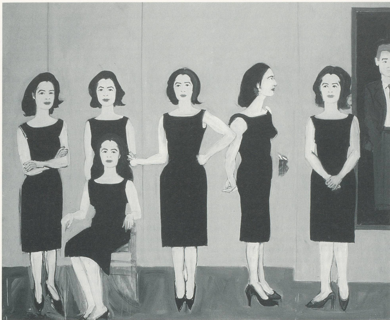
ALEX KATZ, THE BLACK DRESS/DAS SCHWARZE KLEID , 1960, OIL ON CANVAS/ÖL AUF LEINWAND, 71 \frac{1}{2} x 83 \frac{1}{2} "/182 x 212 cm.

ruptures of contemporary American abstract and representational art in the delicate tension of competing formalist and narrative values; emotional content is subdued by formal reduction, light social comedy transformed into an hieratic serial image.