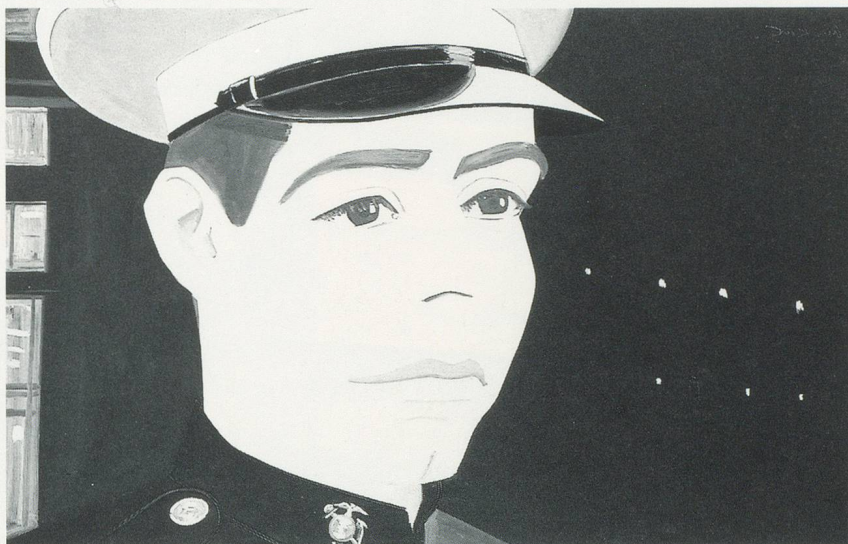
ALEX KATZ, THE MARINE / DER MARINE-SOLDAT, 1966 OIL ON CANVAS / ÖL AUF LEINWAND, 50 x 80 1/2 "/ 127 x 204 cm.

losen «Neufassungen» der Bilder als banale, häusliche Melodramas. Katz strebt vielmehr nach einem Amoralismus, der äusserst bildlich ist: ikonisch, und nicht symbolisch oder psychologisch. Seine besten Gemälde wie THE BLACK DRESS (1960), bei dem ein einzelnes Bild von Ada auf einer Leinwand sechs Mal wiederholt wird, lassen die Krisen und Brüche der zeitgenössischen amerikanischen, abstrakten und gegenständlichen Kunst in der heiklen Spannung schweben, die durch die konkurrenzierenden formalistischen und narrativen Werte entsteht. Der emotionale Inhalt wird durch die formale Vereinfachung abgeschwächt; die lockere Gesellschaftskomödie wird in ein hieratisches Serienbild umgewandelt.