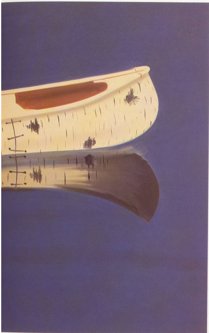
ALEX KATZ, CANOE, 1974, OIL ON CANVAS / ÖL AUF LEINWAND, 72 x 144 " / 183 x 366 cm.

C: I think that you are as interested in film as you are in poetry, but it is the moment, the fleeting moment that most attracts you.