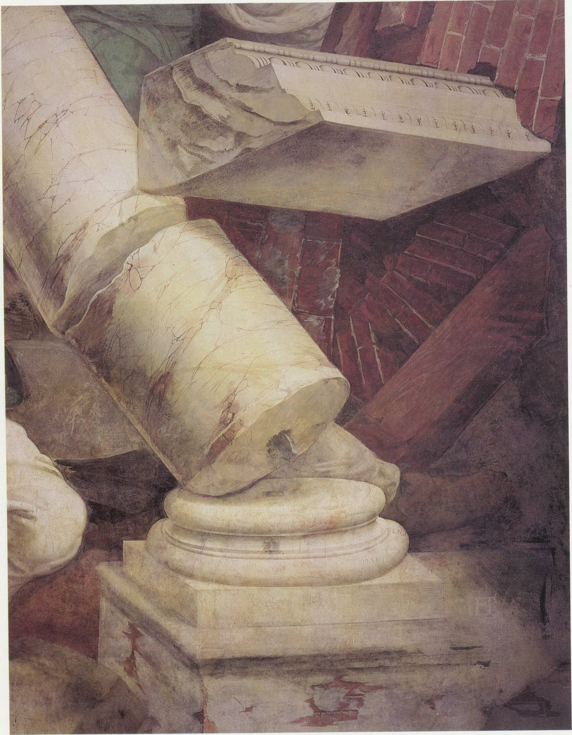
GIULIO ROMANO, SALA DEI GIGANTI, FRESKO, PALAZZO TE.