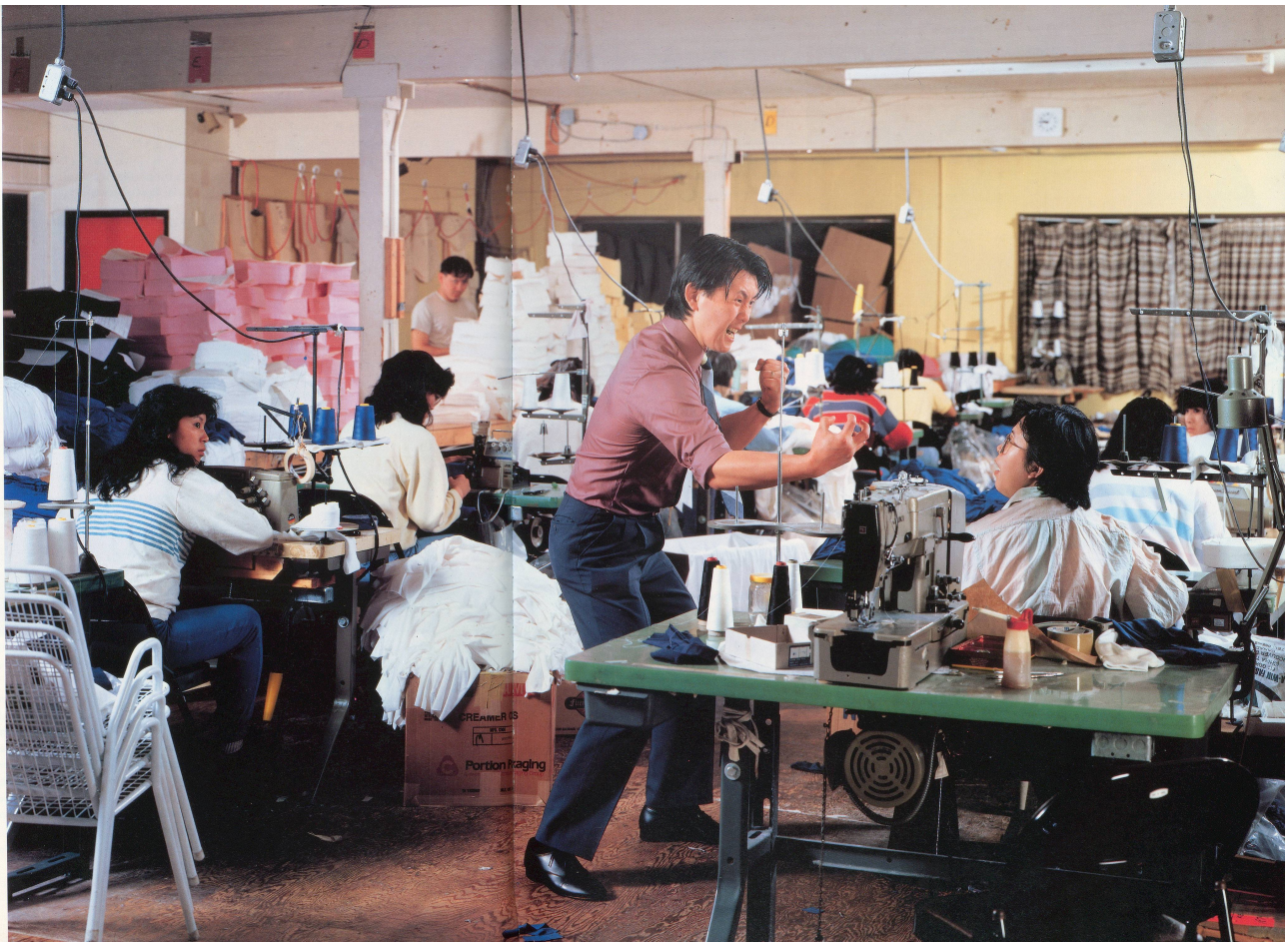
JEFF WALL, OUTBURST / AUSBRUCH, 1989. CIBACHROME TRANSPARENCY, FLUORESCENT LIGHT, DISPLAY CASE / CIBACHROME-DIAPOSITIV, FLUORESCENZLICHT IN KASTEN, 90 x 123 x 229 cm.