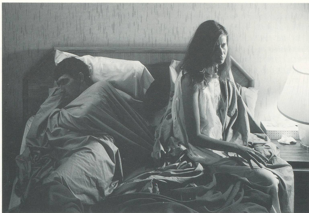
JEFF WALL, THE QUARREL / DER STREIT , 1988, CIBACHROME TRANSPARENCY, FLUORESCENT LIGHT, DISPLAY CASE / CIBACHROME-DIAPOSITIV, FLUORESZENZLICHT IN KASTEN, 47 x 70" / 119 x 178 cm. Ed. of 4. (THE YDESSA HENDELES ART FOUNDATION, TORONTO)

natural or reconstructed settings which are chosen after scouting his locations as carefully as a filmmaker. All of these devices are designed to convince us of the veracity of the image – while, in fact, all is artifice, not only in very elaborate works like ABUNDANCE (1985) or QUARREL (1988), but also in apparently spontaneous works such as DIATRIBE (1985) and MIMIC (1982). The sumptuousness of the “super photographs,” as Els Barents 1 calls them, protected by their system of presentation, produces a “hands-off” effect that keeps the spectator at a distance.