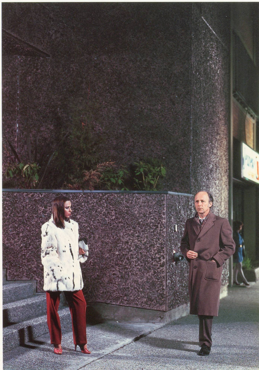
JEFF WALL, NO / NEIN, 1983, CIBACHROME TRANSPARENCY, FLUORESCENT LIGHT, DISPLAY CASE / CIBACHROME-DIAPOSITIV, FLUORESZENZLICHT IN KASTEN, 130 x 90" / 330 x 229 cm.