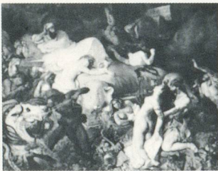
EUGÈNE DELACROIX, LA MORT DE SARDANAPAL , 1827.

ARIELLE PÉLENC is a French critic who lives in Paris and Villers-Cotterets.