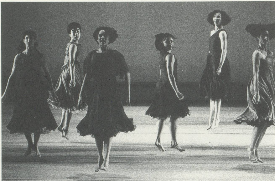
MARK MORRIS AND THE MONNAIE DANCE GROUP, L'ALLEGRO, IL PENSEROSO ED IL MODERATO, 1988.