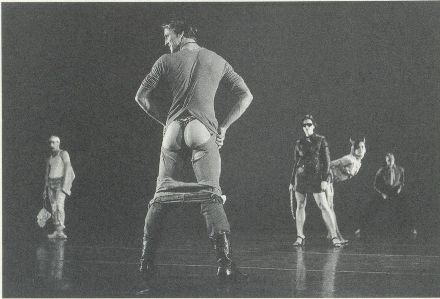
MARK MORRIS AND THE MONNAIE DANCE GROUP, STRIPTEASE, 1986.