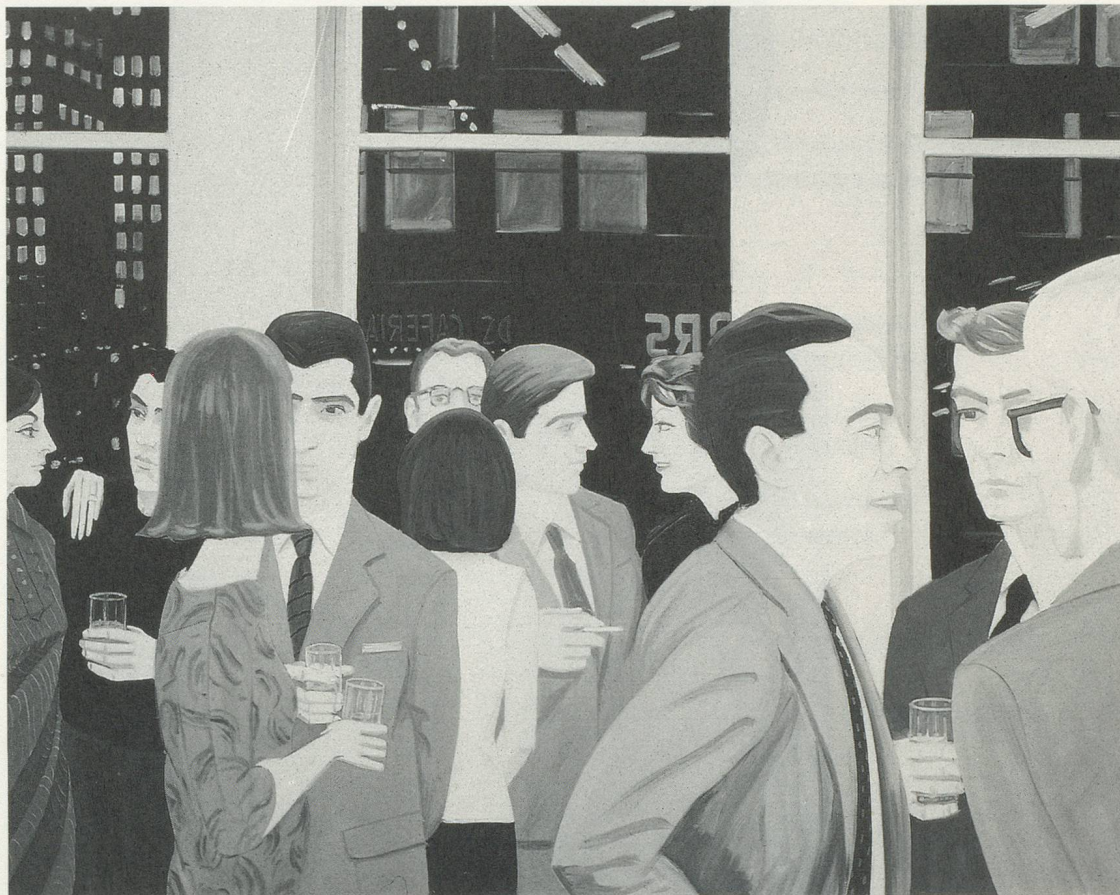
UMSCHLAG / COVER: ALEX KATZ, PASSING / VORÜBERGEHEN (SELF-PORTRAIT), 1962-63, OIL ON CANVAS / ÖL AUF LEINWAND, 79 5 / 8 x 71 3 / 4 "/ 202 x 183 cm. (COLLECTION, THE MUSEUM OF MODERN ART, NEW YORK)