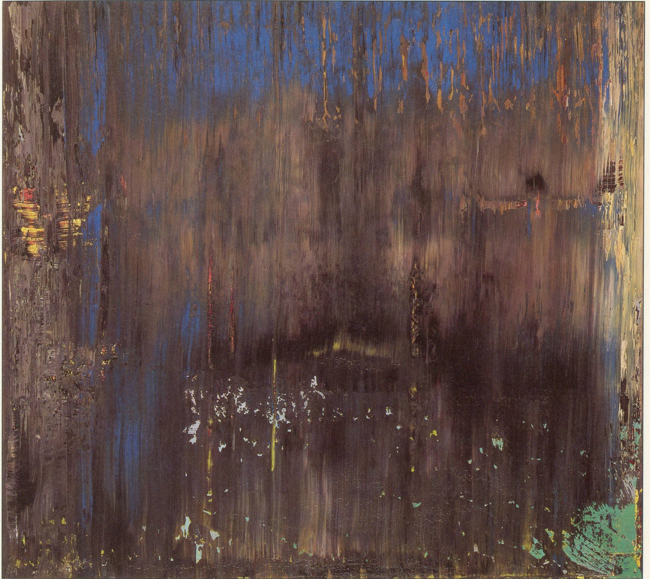
Abstract Painting (677-2), 1988, Oil on Canvas, 40" x 44"