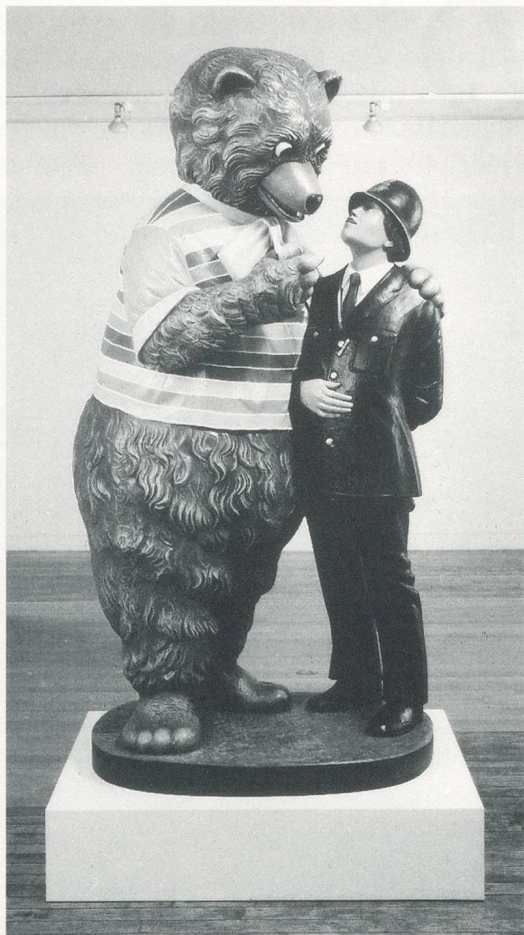
JEFF KOONS, BEAR AND POLICEMAN / BÄR UND POLIZIST, 1988, POLYCHROMED WOOD / GEFASSTES HOLZ, ED. OF 3, 85 x 43 x 36 "/>

size and scale, relative to their source images. Trinkets turned into statues and vice versa. A saint-like Buster Keaton (based on a movie still), his hand gripping the end loop of the reins on the burro he straddles, configures an image of masturbation. In NAKED , the cloying, Garden