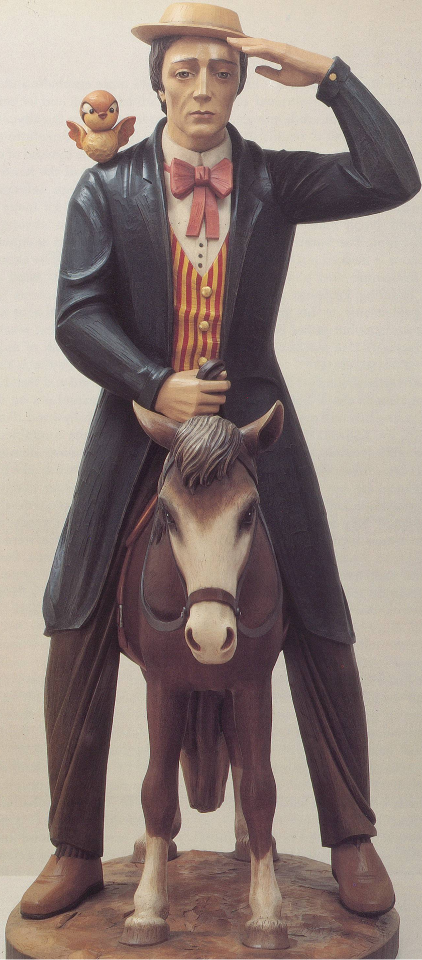
JEFF KOONS, BUSTER KEATON, 1988. POLYCHROMED WOOD / GEFASSTES HOLZ, ED. OF 3, 65 3 / 4 x 50 x 26 1 / 2 "/ 167 x 127 x 67 1 / 8 cm.