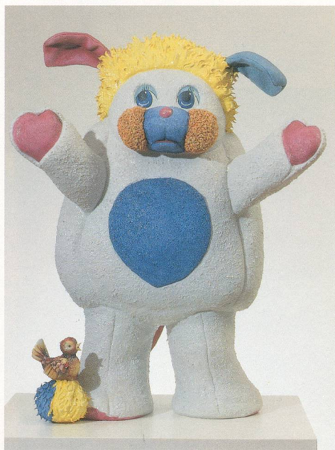
JEFF KOONS, POPPLES, 1988, PORCELAIN / PORZELLAN, ED. OF 3, 29 1/4 x 23 x 12 "/ 74,3 x 58,4 x 30,5 cm.