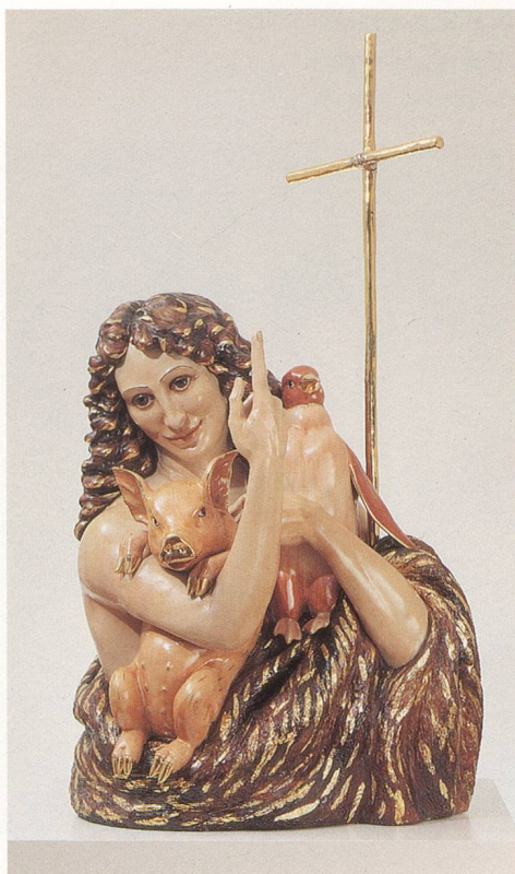
JEFF KOONS, SAINT JOHN THE BAPTIST / HEILIGER JOHANNES DER TÄUFER, 1988, PORCELAIN / PORZELLAN, ED. OF 3, 56½ x 30 x 24½" / 143,5 x 76,2 x 62,2 cm.

Die verdrehende und verdrehte Logik Jeff Koons' greift allerdings nicht allein das Kunsthandwerk auf, sondern auch den abhanden gekommenen, emotionalen Inhalt der Kunst. Seine extravaganten Kreationen suhlen sich in einer klebrigfingrigen Heruntergekommenheit und Sentimentalität, die für das «desetablierte» Kunsthandwerk ebenso typisch sind wie für den etablierten Brei, jedoch seit den Präraffaeliten und Bouguereau in der hohen Kunst selten mehr zu sehen waren. Herzen und Blumen, die Embleme und Stigmata erotischer wie religiöser Sentimentalität, schmücken die meisten der neuen Skulpturen. Das Männliche, Weibliche und Tierische werden missbraucht (zuweilen auch von sich selbst) und als fetischistische Cartoons des Voyeurismus idealisiert.