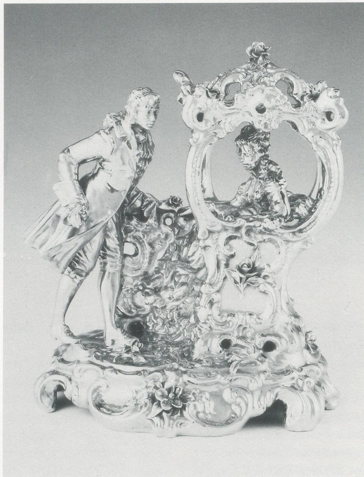
JEFF KOONS, FRENCH COACH COUPLE / FRANZÖSISCHES SÄNFTE-PAAR, 1986, STAINLESS STEEL / STAHL, 17 x 15 1 / 2 x 11 3 / 4 " / 43,2 x 39,4 x 30 cm.