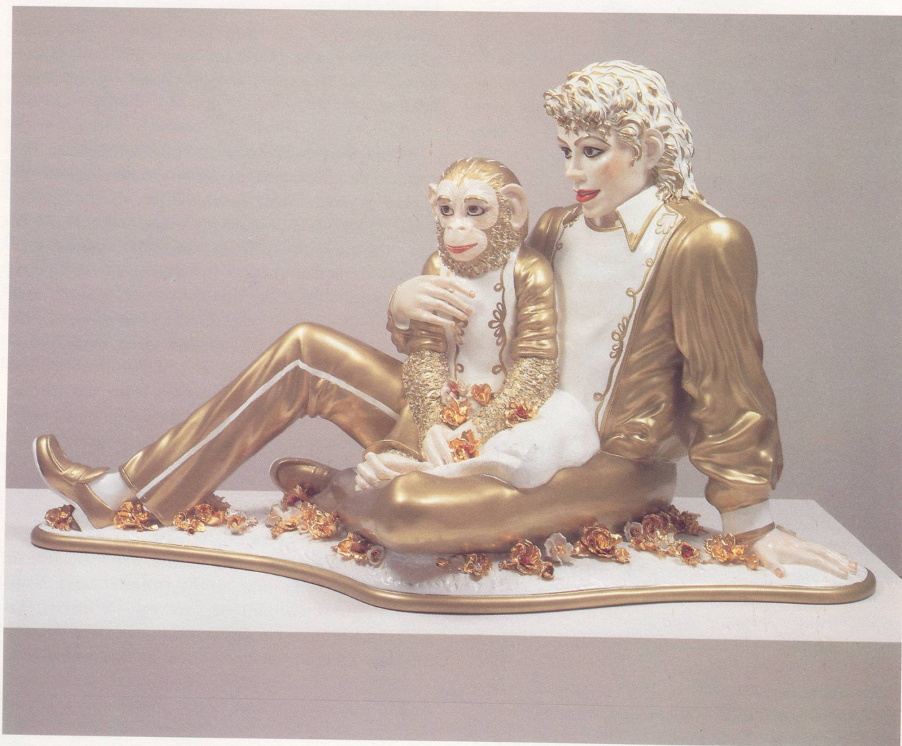
JEFF KOONS, MICHAEL JACKSON AND BUBBLES, 1988

PORCELAIN/PORZELLAN, ED. OF 3, 42 x 70½ x 32½" / 106,7 x 179 x 82,5 cm.