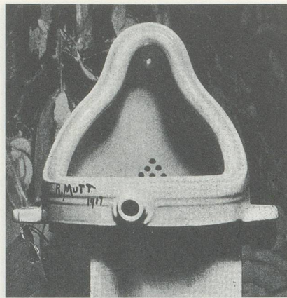
MARCEL DUCHAMP, FOUNTAIN, 1917. (THE LOUISE AND WALTER ARENSBERG COLLECTION, PHILADELPHIA MUSEUM OF ART)

The work of these contemporary artists is being comfortably assimilated into the art industry. Like Duchamp's, their art questions the belief in authenticity and originality, or exposes the