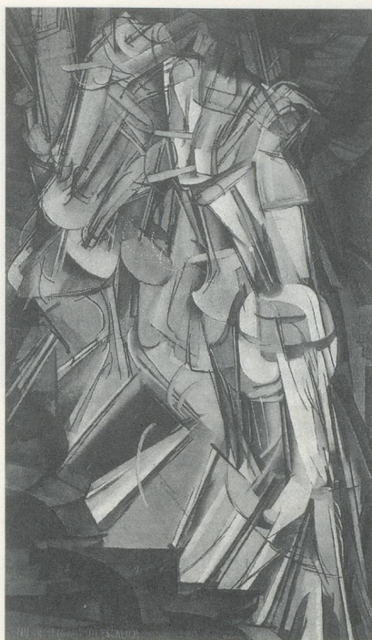
MARCEL DUCHAMP, NUDE DESCENDING A STAIRCASE, NO. 2 , 1912. (THE LOUISE AND WALTER ARENSBERG COLLECTION, PHILADELPHIA MUSEUM OF ART)

And of course, Duchamp's purported silence did not preclude a lot of action behind the scenes. We now know that twenty years of apparent inactivity were spent nursing along the elaborate construction of ETANT DONNÉS . Duchamp arranged things so that the tableau would be left to the museum and installed after his death, with the aid of only a few confidants and a photographic instruction man-