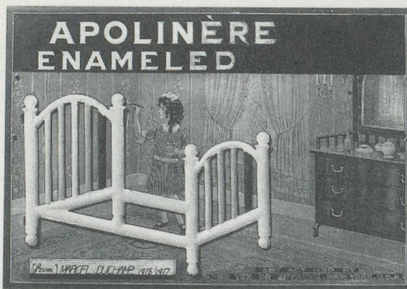
MARCEL DUCHAMP, READY-MADE, 1916–17. (THE LOUISE AND WALTER ARENSBERG COLLECTION, PHILADELPHIA MUSEUM OF ART)

Im GROSSEN GLAS selbst sind die Jungesellen («malic molds») so angeordnet, dass das «Leuchtgas» des Apparats sie erreicht. Levine transponierte einfach die von Duchamp in der GRÜNEN SCHACHTEL spezifizierten «Gassgiessereien» in die Wirklichkeit. Der Unterschied besteht natürlich darin, dass die Jungesellen nun nicht mehr – wie im GROSSEN GLAS – am «Sexpunkt» miteinander in Verbindung stehen, sondern aus dieser typisch perspektivischen Anordnung, durch die Duchamp ihre Gruppierung festlegte, herausgelöst sind. Auch sind sie bei Duchamp lediglich ein Element innerhalb der ausgeklügelten Arbeitsweise einer Jungesellenmaschine. Das Gas geht bald vom festen in den flüssigen Zustand über und setzt seine Reise auf die Braut zu fort. Bei Levine hingegen gibt es keinen Prozess und kein Versprechen, nur unheimliche Stille.