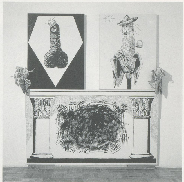
MIKE KELLEY, PAGAN ALTAR/HEIDNISCHER ALTAR, 1989, ACRYLIC ON THREE PANELS WITH 2 BOARDS AND 2 BUNCHES OF DRIED CORN/ACRYL AUF 3 FELDERN MIT 2 TAFELN UND 2 BÜSCHELN GETROCKNETEN MAIS,

Das darf ein Künstler wieder mal nicht sagen: Pornos, Arschwitze, Scheisse, Schmutz – so dass Kelley damit definitiv ein Potential gewonnen hat. In einer etwas eleganteren Form war auch die Arbeit mit