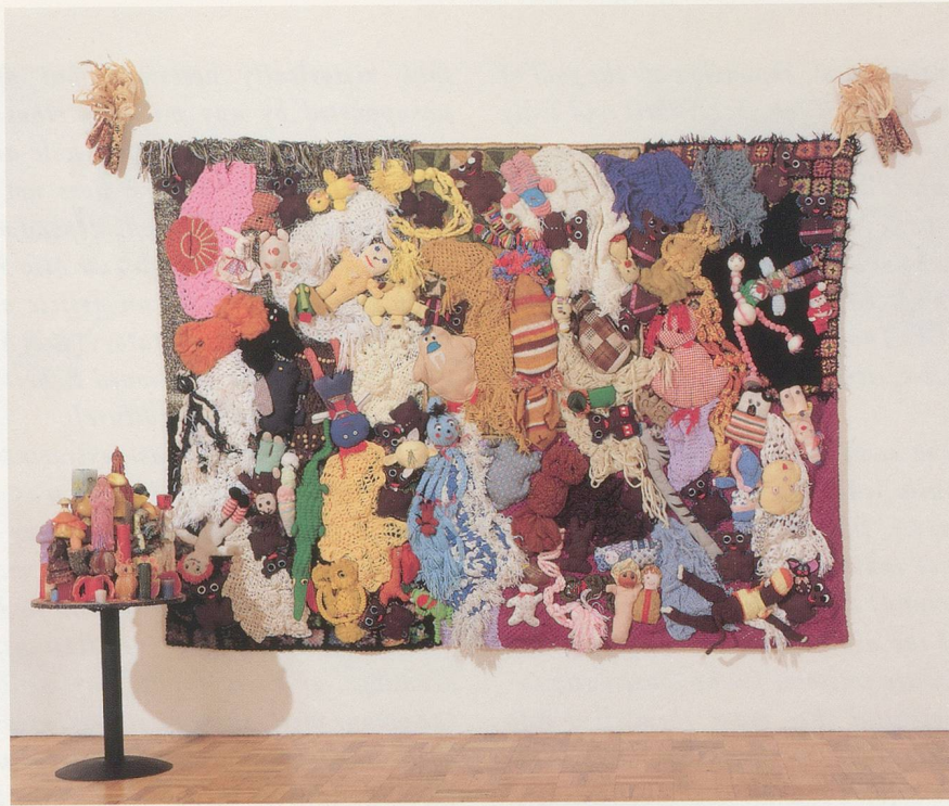
MIKE KELLEY, MORE LOVE HOURS THAN CAN EVER BE REPAID / MEHR LIEBESTUNDEN ALS JE ZURÜCKBEZAHLT WERDEN KÖNNEN , 1978, MIXED MEDIA, 96 x 127 x 6" / 244 x 323 x 15 cm. UND / AND: THE WAGES OF SIN / DER LOHN DER SÜNDE , 1987, WAX CANDLES ON ROUND BASE / WACHSKERZEN AUF RUNDEM GESTELL .