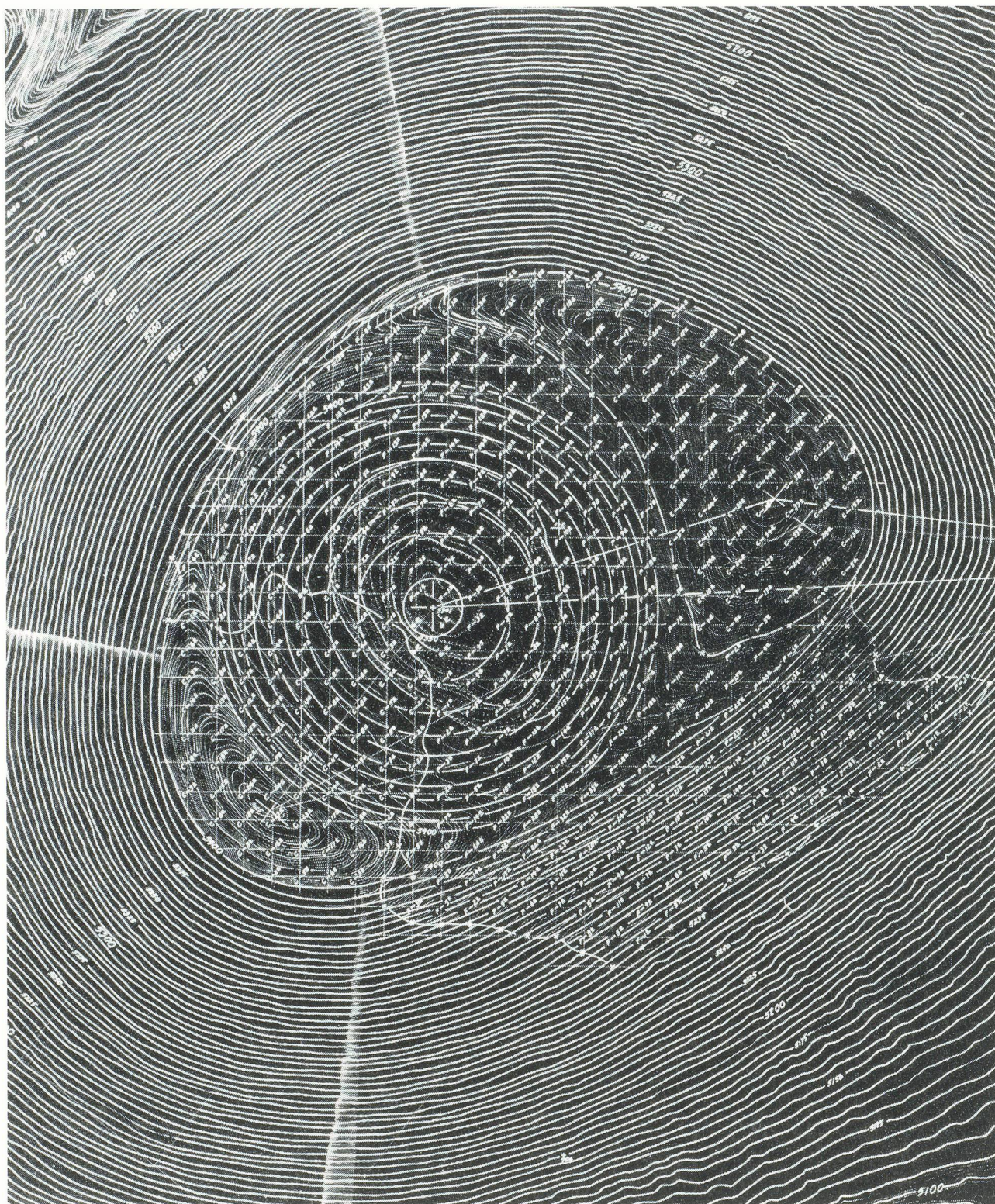
JAMES TURRELL, CUT AND FILL (RODEN CRATER), 1980. Ink and pencil on mylar, 36 x 72" / ABTRAGUNGEN UND AUFSCHÜTTUNGEN, Tinte und Bleistift auf Mylar, 91,5 x 183 cm (Detail).