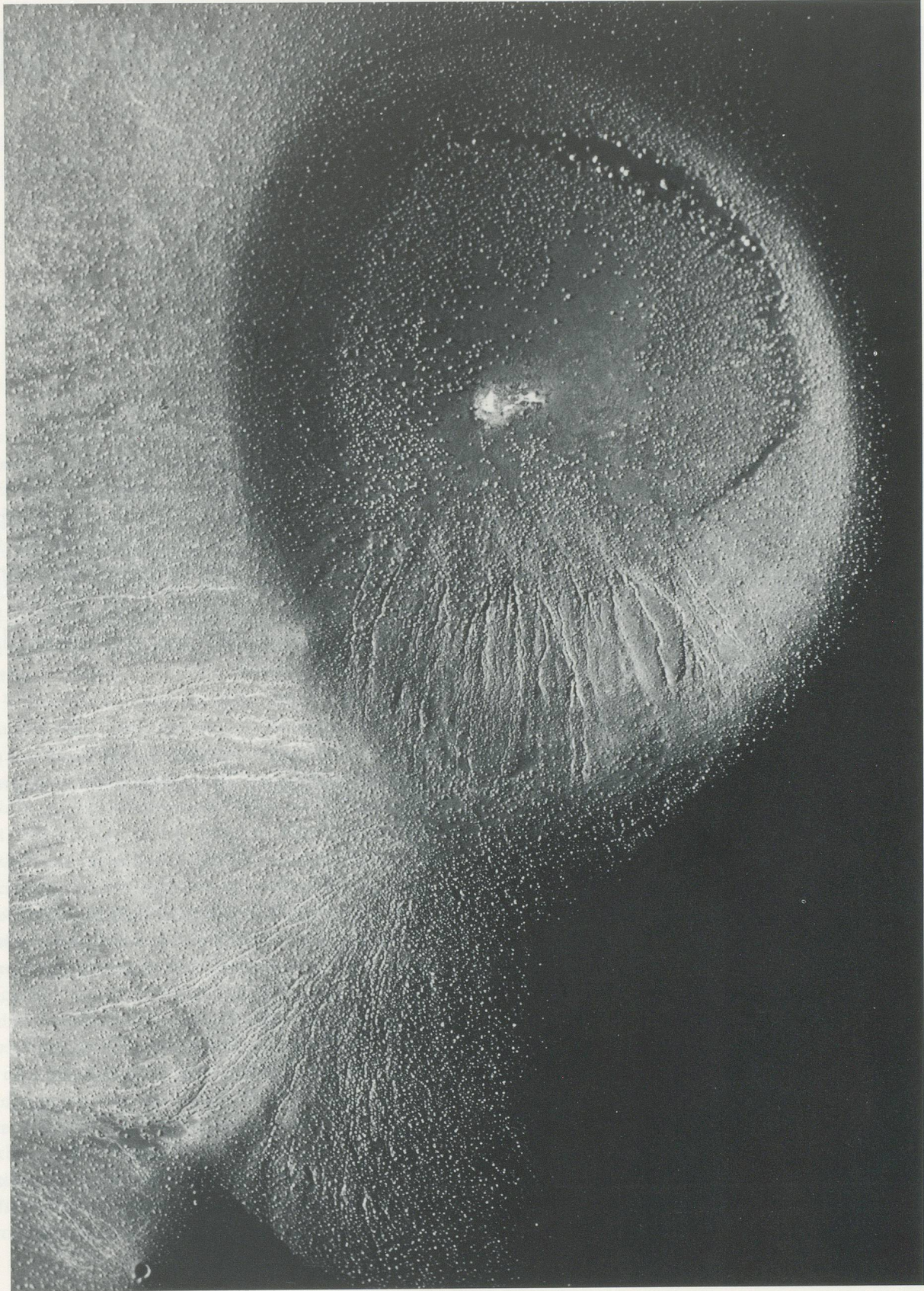
RODEN CRATER BEI/NEAR FLAGSTAFF, ARIZONA