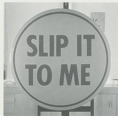
RICHARD HAMILTON, EPIPHANY, 1964–69, cellulose on aluminium, 45"/EPIPHANY, Cellulose auf Aluminium, 114 cm.

Im nachhinein lässt sich Hamiltons Werk nicht ganz so leicht einordnen: das Pop-Etikett ist nicht nur zu eng, sondern auch unzutreffend geworden. Im Zentrum seiner Arbeit liegt eine unerschütterliche, wenn auch paradoxe Treue zu einem Begriff von Malerei, der sie den Schönen Künsten zurechnet und der für Hamilton den ehrgeizigen Glauben an die Möglichkeit beinhaltet, ihre dahindämmernde Fähigkeit zu unüberhörbaren Aussagen über die Wirklichkeit wiederzubeleben, eine Fähigkeit, die eng mit ihrem mythenschaffenden Potential zusammenhängt. Das mag insofern paradox klingen, als viele seiner künstlerischen Aktivitäten sich stets über Kanäle geäussert haben, die nicht eigentlich der Malerei zugerechnet werden, also nicht bloss über verschiedene Formen der Druckgraphik, sondern über Photographie, verschiedene Typen von multiples , Schreiben und selbst Industriedesign; paradox