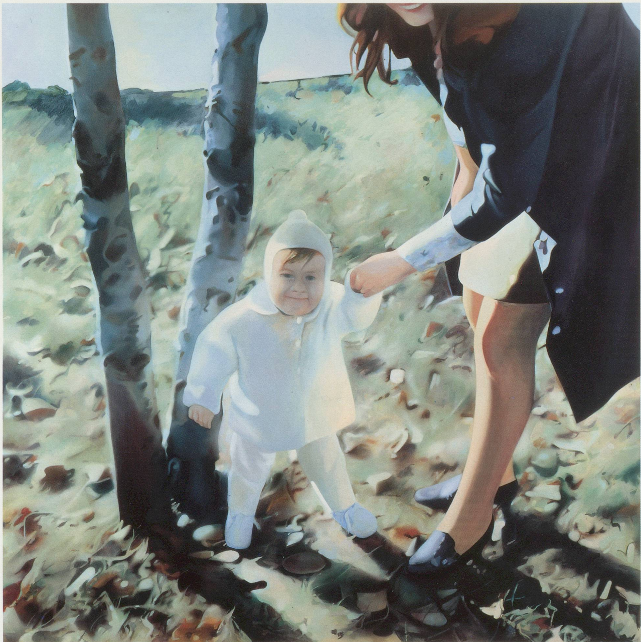
RICHARD HAMILTON, MOTHER AND CHILD , 1984–85, oil on canvas, 59 x 59”/MUTTER UND KIND, Öl auf Leinwand, 150 x 150 cm.

turing closeness, etc, but what is ultimately most telling is the fact that for all its apparent banality the result is anything but banal.