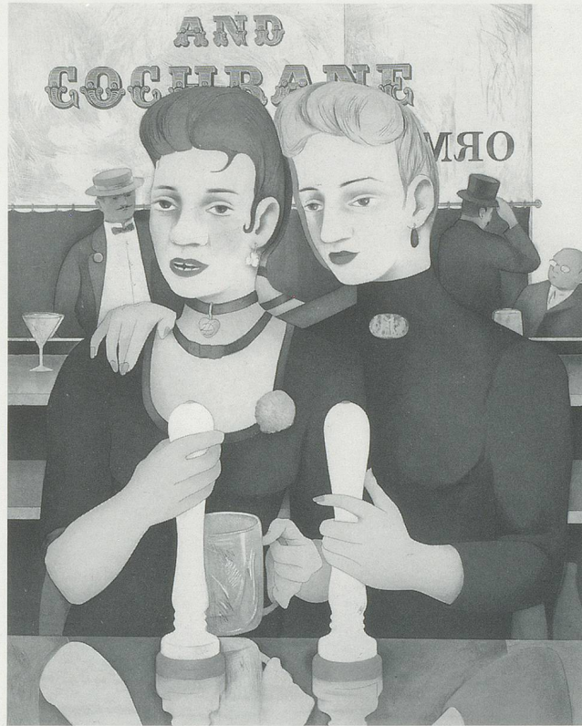
RICHARD HAMILTON, BRONZE BY GOLD , 1985–87, colour etching in 23 colours from 5 plates, 20 3 / 4 x 19 3 / 4 " (PLATES); 30 x 22" (SHEET)/ BRONZE MAL GOLD, Radierung aus fünf Platten in 23 Farben, 53 x 42,5 cm (PLATTE); 76 x 56 cm (BLATT).

to invoking art's highest aspirations as they are traditionally manifest in the conventions of history painting. The impetus for this comes partly from the recognition that while the traditional genres have a revered lineage in Western art many of them have lately become all but redundant: to grapple with them becomes therefore a challenge to update them, to render them, however temporarily, viable, and, equally