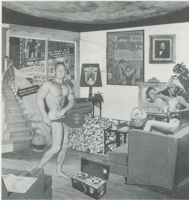
RICHARD HAMILTON, JUST WHAT IS IT THAT MAKES TODAY'S HOMES SO DIFFERENT, SO APPEALING? , 1956, collage, 10 \frac{1}{4} x 9 \frac{3}{4} " / WAS IST ES NUR, DAS HEUTZUTAGE DAS HEIM SO ANDERS, SO ANSPRECHEND MACHT? , Collage, 26 x 25 cm.

DIFFERENT, SO APPEALING? of 1956, – not an exhibit but a design to be reproduced in the catalogue and on the poster for the exhibition entitled This is Tomorrow , (an exhibition which brought most of the former Independent Group members their first widespread public attention) – is generally considered the first Pop icon. That Hamilton should soon after have introduced such mass media material and styles into his own art and then, several years later, have enthusiastically championed the works of Lichtenstein and Warhol was seen to confirm his seminal place within the international Pop milieu. This view was, in turn, reinforced by such activities as the designing of a record sleeve for the Beatles, as well as by several of the highly idiosyncratic paintings that he produced in the mid-sixties, such as EPIPHANY of 1964, based on a button containing the phrase “Slip it to me” which he had found in a seedy Los Angeles joke store.