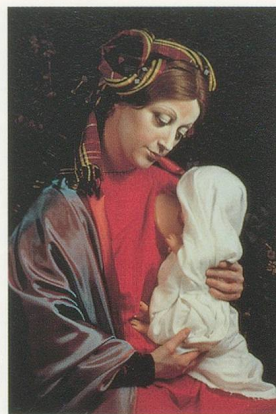
CINDY SHERMAN, UNTITLED # 223, 1990, color photo, 58 x 42"/OHNE TITEL NR. 223, 1990, Farbphoto, 147,3 x 106,6 cm.

female gestation seems to “cow” the woman’s gaze. Her consciousness? Somewhere in the sphere between innocence and immanence. Sherman’s