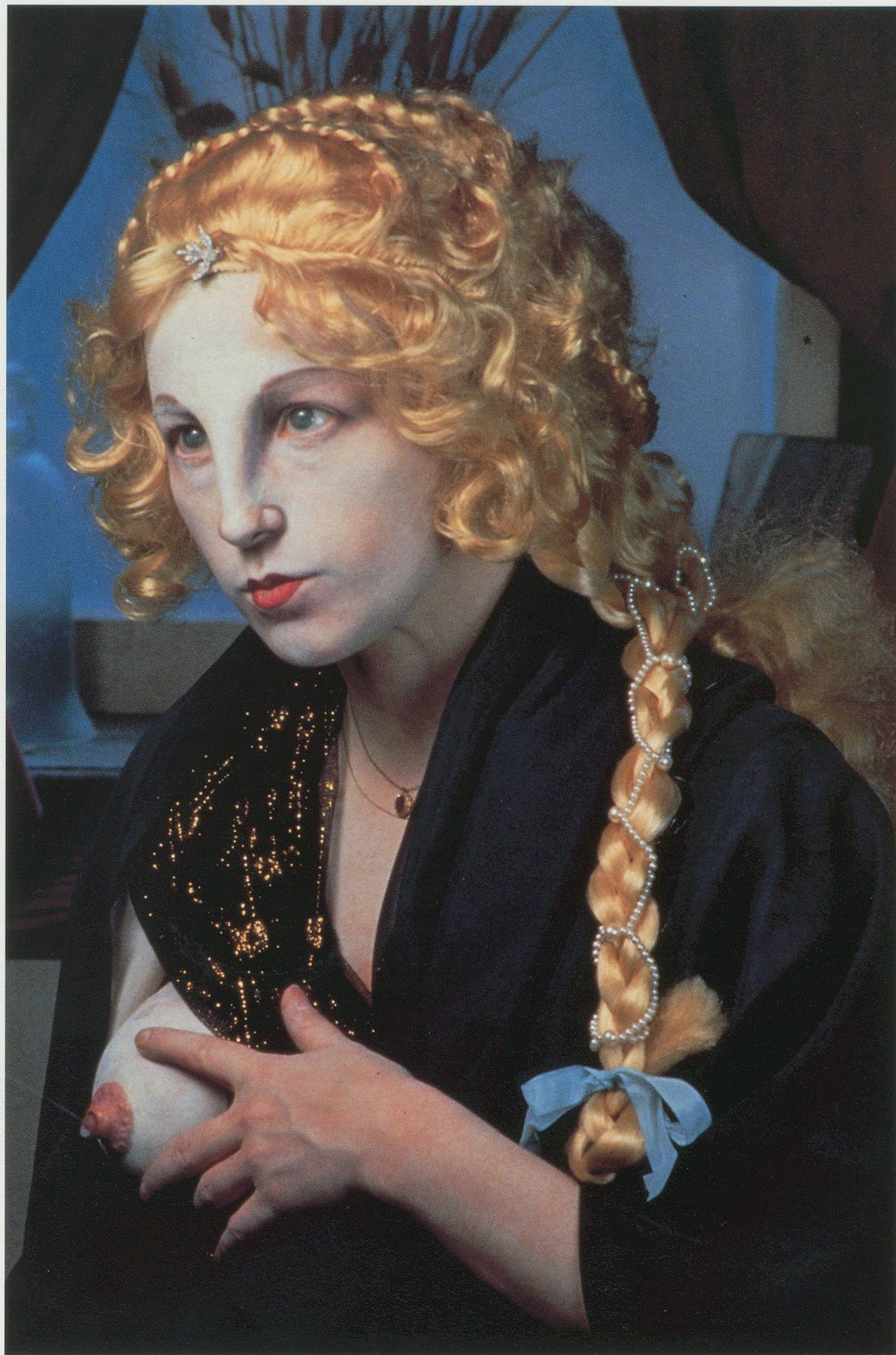
CINDY SHERMAN, UNTITLED # 225, 1990, color photo, 48 x 33"/OHNE TITEL NR. 225, 1990, Farbphoto, 122 x 83,8 cm.