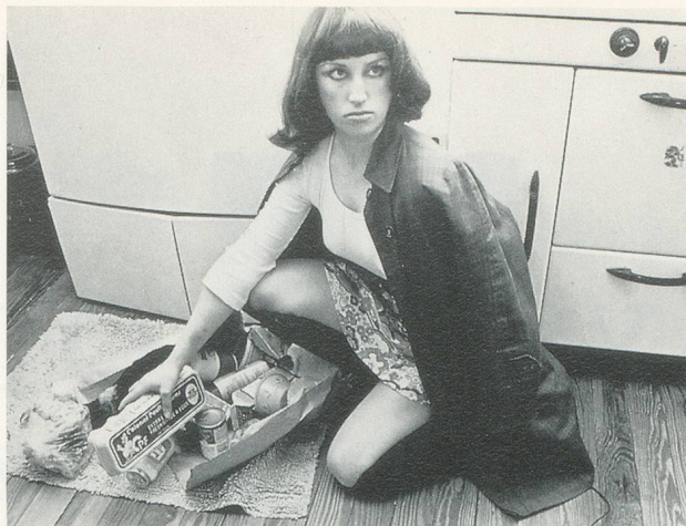
CINDY SHERMAN, UNTITLED FILM STILL # 10, 1978, b/w photo, 8 x 10"/FILMSTANDBILD OHNE TITEL NR. 10, 1978, s/w-Photo, 20,3 x 25,4 cm.

V. Untitled Vielleicht trägt Cindy Sherman bei zur definitiven Entlastung der Moderne von ihren selbstaufgelegten Schwergewichten: Identität, Schönheit, Wahrheit, Bedeutung; das konstante untitled ist Programm, Absage an die Eindeutigkeit einer Be-Deutung, an die Eindimensionalität von Interpretament, Klassifizierung, Analyse – letztlich auch Absage an Aussage, Pädagogik (auch feministische) und erst recht: Kunst als Mittel der Aufklärung. Und vielleicht ist Welt = Realität das, was ständig